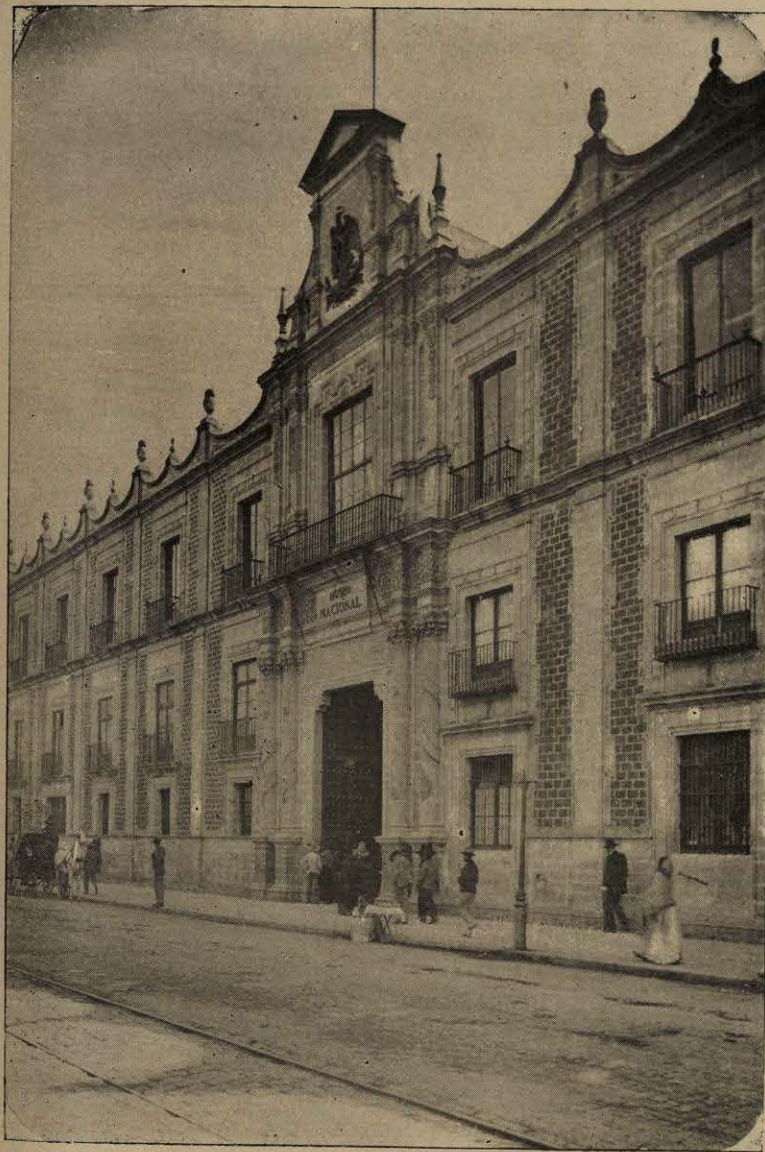
Exterior del Museo Nacional.