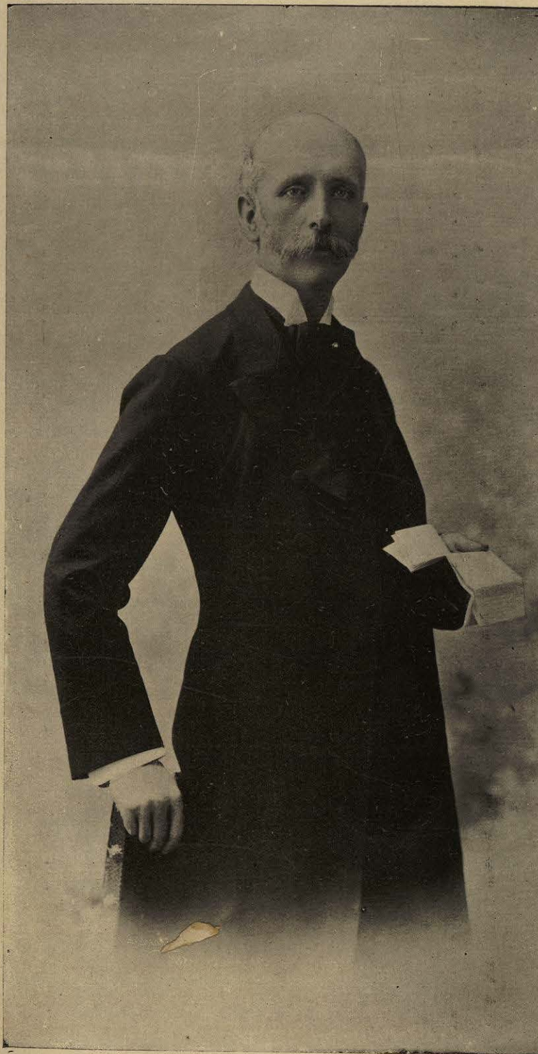
SR. LIC. D. JOSÉ YVES LIMANTOUR, Secretario de Hacienda y Crédito Público.

De la misma manera que atiende al Ejército de tierra, se ocupa activamente el Gobierno en fomentar nuestra incipiente