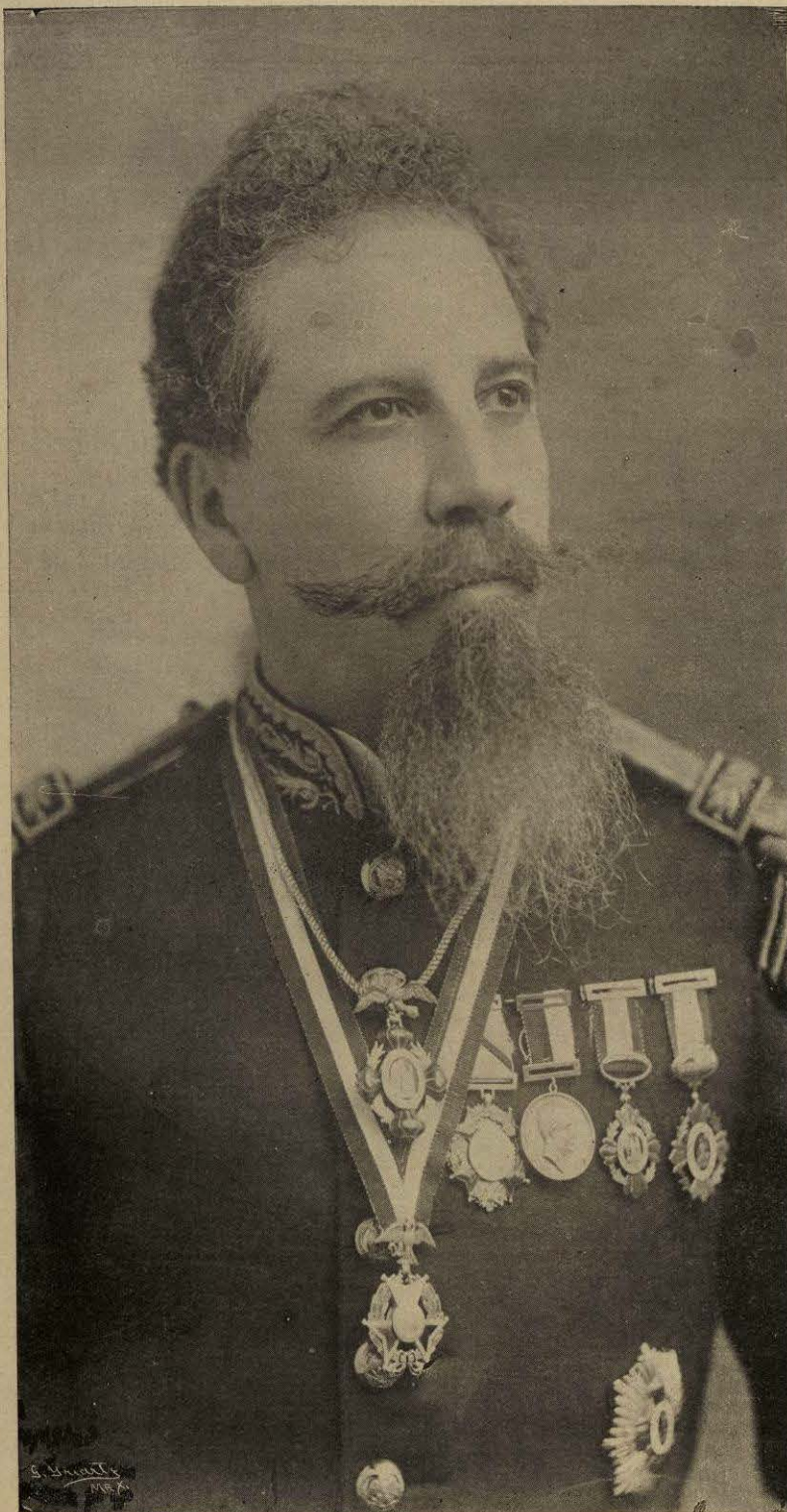
SR. GRAL. D. BERNARDO REYES, Secretario de Guerra y Marina.