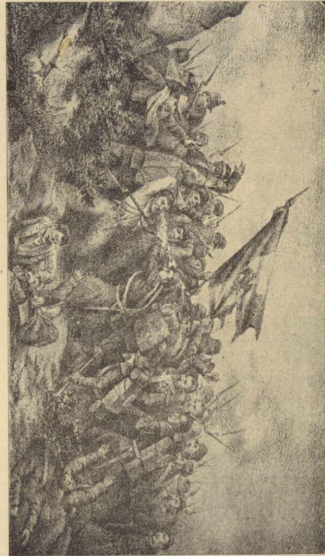
UN EPISODIO EN EL SITIO DE PUEBLA.

Más de una vez han dicho los enemigos del General