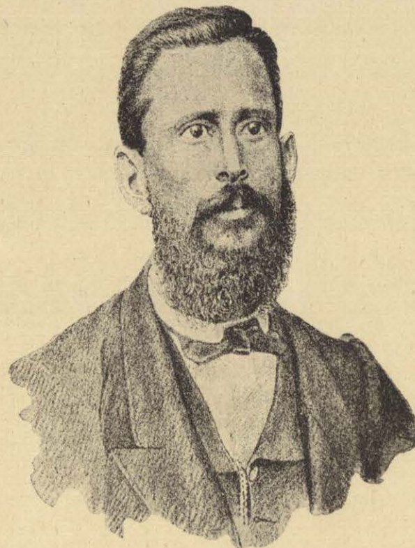
GENERAL LUIS PÉREZ FIGUEROA.

“El mal éxito que el Conde de Tum había alcanzado en su campaña de la sierra de Puebla le tenía de mal humor. Al día siguiente de su arribo á Puebla, vino á la prisión y me llamó al salón de la corte marcial, que estaba en el mismo edificio, y allí me previno, con maneras bastante duras, que firmara una carta, previamente escrita, en que ordenara yo al General D. Juan Francisco Lucas, que no fusilara á los jefes y oficiales traidores que tenía prisioneros, porque el gobierno imperial se proponía canjearlos por algunos