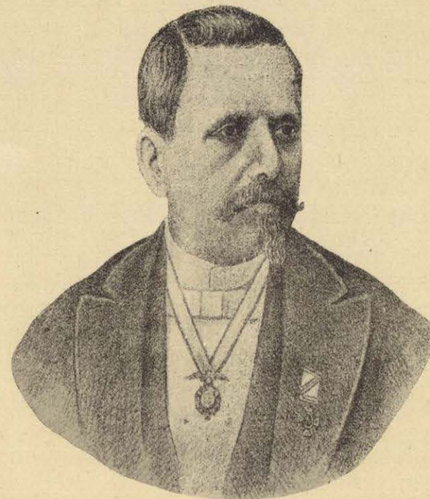
GENERAL GUILLERMO PALOMINO.

“Sudoroso y agitado por la fatiga, emprendí violentamente mi marcha para la casa donde tenía mis caballos, mi crido y el guía, y pude, sin más tropiezo llegar á ella.