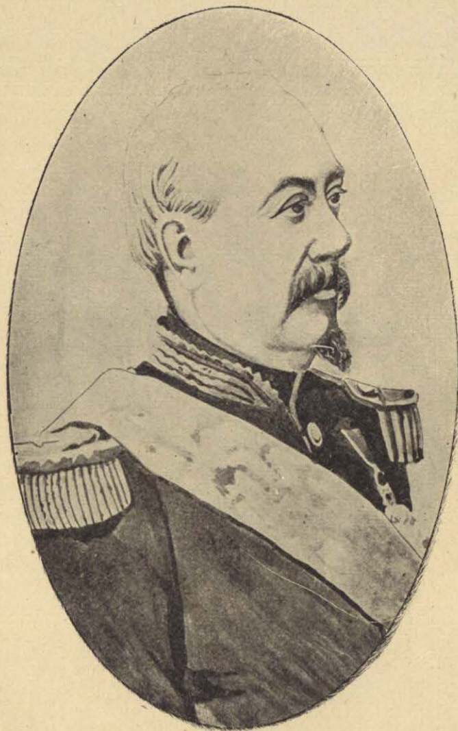
MARISCAL FRANCÉS ACHILE BAZAINE

“Terminó el año de 1864 y las fuerzas enemigas estaban á pocos kilómetros de la ciudad. Dos ó tres días después del reconocimiento hecho por el General Courtois d'Hurbal, se movió toda la fuerza francesa y traidora y comenzó á establecer su línea de circunvalación. El General Bazaine llegó al campo enemigo el 15 de Enero de 1865 y asumió desde luego el mando en jefe. Los franceses ocuparon primero lo que ellos llamaban Primer Dominante, y cuyo nombre vulgar es el “Cerro Pelado Grande,” el “Monte Alban” y el “Pueblo de Xoxo;” siguieron perfeccionando sus paralelas, no con resistencia decisiva, pero sí con pequeños tiroteos por parte de la plaza, que tendían á dificultar sus obras, las que completaron