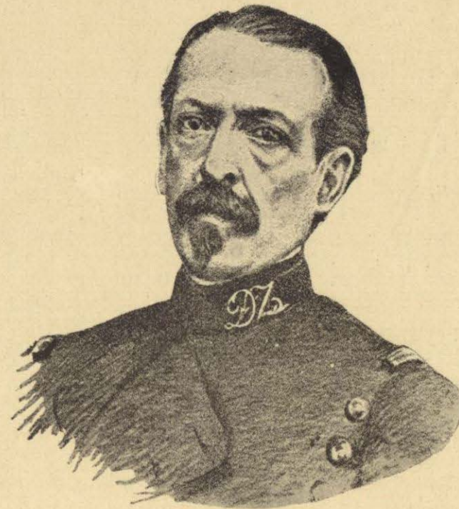
CORONEL MIGUEL AUZA.

Todos estos preparativos y esta actividad de parte del General Díaz, llamó la atención de los imperialistas á ésta parte de la República, puesta por Juárez al cuidado de dicho General, é inmediatamente se tomaron disposiciones para irlo á combatir á Oaxaca. Con ese fin se mandaron á ese Estado dos fuertes columnas, una al mando del General Courtois d'Hurbal y la otra conducida por el Brigadier Brincourt. Anteriormente, sin embargo, se habían situado otras fuerzas francesas menos importantes en el Estado. Pero ninguna de éstas se había atrevido á avanzar hacia la capital, ó comprometerse seriamente con el ejército liberal que había organizado y disciplinado el General Díaz, y que lo tenía bien preparado para la lucha que pronto tendría lugar, y que decidiría si el Estado de Oaxaca quedaba en