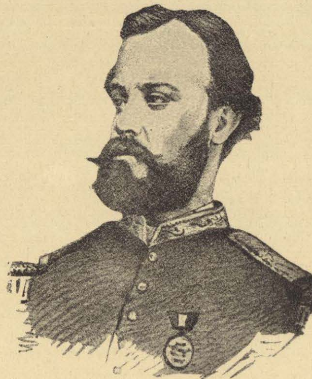
GENERAL IGNACIO R. ALATORRE

“Es lamentable que el Coronel Espinosa y Gorostiza se hubiera encontrado con ese obstáculo que él creyó insuperable; pero su concurrencia me hubiera bastado, sin duda, para tomar el pueblo de San Antonio, derrotar definitivamente á la columna del General Brincourt y apoderarme de un rico convoy que se encontraba en aquel pueblo y que por un momento