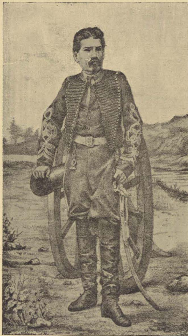
CORONEL FÉLIX DÍAZ.