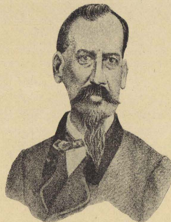
GENERAL RAFAEL BENAVIDES.

Los conservadores prometían paz al país, que había sido azotado tan largo tiempo por la guerra civil; la Iglesia naturalmente apoyaba la intervención, que sostenía la autoridad eclesiástica y sus antiguos privilegios y dignidades; y el populacho, que apenas