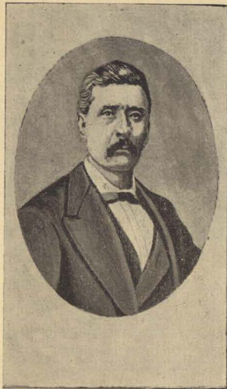
GENERAL PORFIRIO DIAZ EN 1863.

ción era insuficiente y los víveres dentro de los muros de la Ciudad apenas si bastarían para mes y medio. Así es que aún cuando las fuerzas llegaban á cerca de 24,000 hombres, su capacidad efectiva de combate no llegaba á lá mitad de esa cifra debido á muchas deficiencias en las líneas de defensa y á escasez de implementos militares y provisiones. Por lo tanto, tan considerable número de hombres en el interior de la ciudad, constituía más bien una amenaza que un elemento para la defensa de la misma.