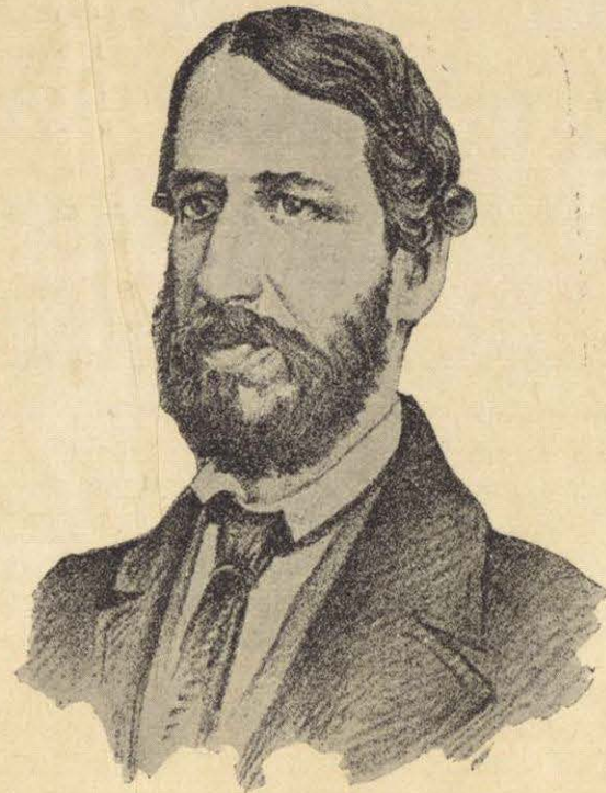
GENERAL IGNACIO DE LA LLAVE.

El Estado estaba infestado de ladrones y guerrilleros, y entre estos últimos, muchos de ellos no tenían el menor interés en la cuestión política que agitaba el país, pero todos ellos pretendían pertenecer á un partido ú otro; pues esto les aseguraba el ser tratados como prisioneros de guerra en caso de ser capturados. Todo el Estado estaba erizado de dificultades y peligros de toda naturaleza, pero el General Díaz logró que su autoridad fuera respetada en todas las comarcas que tenía encomendadas. Mas el gobierno de Juárez tenía tantas dificultades contra que luchar, que no podía auxiliarlo de ningún modo: ni con hombres, ni con pertrechos de guerra, ni con su autoridad; y el General Díaz comprendió que las dificultades de mantener parcialmente la autoridad del partido liberal en el Estado de Veracruz, eran mayores que el beneficio que se derivaba. Además, juzgó