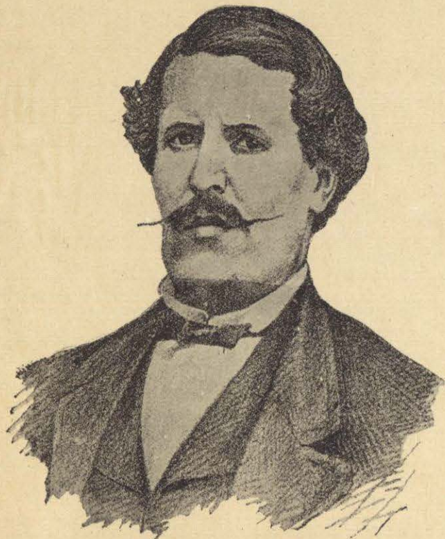
GENERAL JESÚS GONZÁLEZ ORTEGA.