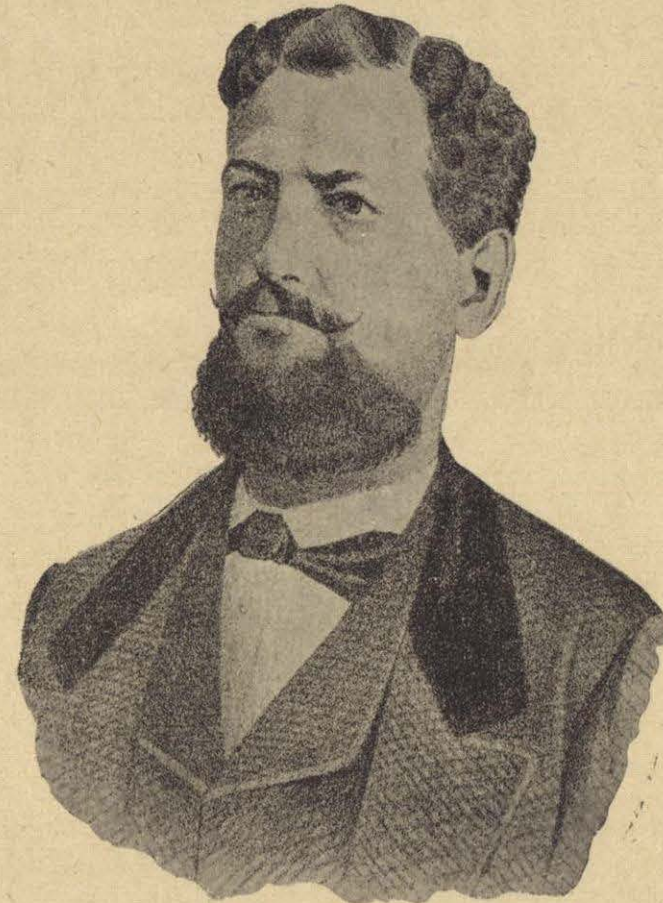
GENERAL SANTIAGO TÁPIA.

Entre tanto Zaragoza declaró la capital de la República en estado de sitio, y se preparó para defenderla hasta el último extremo, en el caso desgraciado de que fuera rechazada la fuerza comparativamente pequeña mandada contra Márquez y Mejía. Puebla había sido tomada poco antes por los conser-