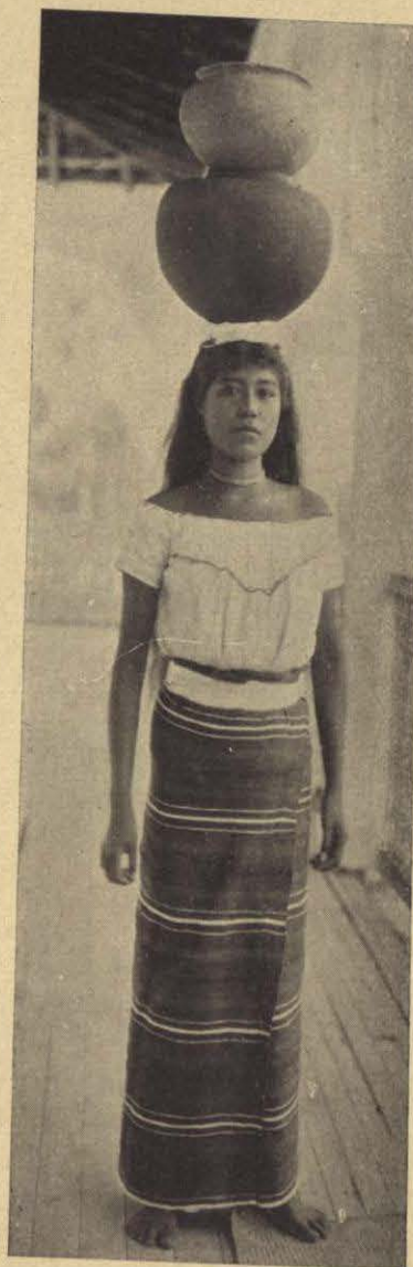
INDIA DEL ESTADO DE PUEBLA.

Pero llegar hasta la plaza sin ser notados, no era tarea fácil; pues Márquez era buen soldado y conocía perfectamente los riesgos de la clase de guerra que estaban llevando á cabo en esos días por los distritos montañosos de México; y sobre todo, apreciaba el peligro de tener en la vecindad un enemigo como el Coronel Díaz. Por consiguiente, había colocado al rededor de la ciudad doble línea de centinelas de á pie y de á caballo.