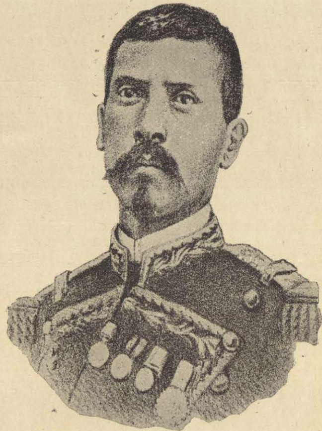
PORFIRIO DÍAZ EN 1861.

Era Márquez hombre de gran audacia y talento militar, y era con mucho, el adversario más temible que tenía Juárez por ese tiempo. Poseía gran tenacidad y perseverancia, y conocía perfectamente á todos los guerrilleros que hostilizaban al país, desde sus seguros refugios en las montañas; de donde salían de tiempo en tiempo. Y así le era posible en pocos días reunir un ejército bastante respetable, con tanta mayor facilidad, cuanto que gozaba de la reputación de