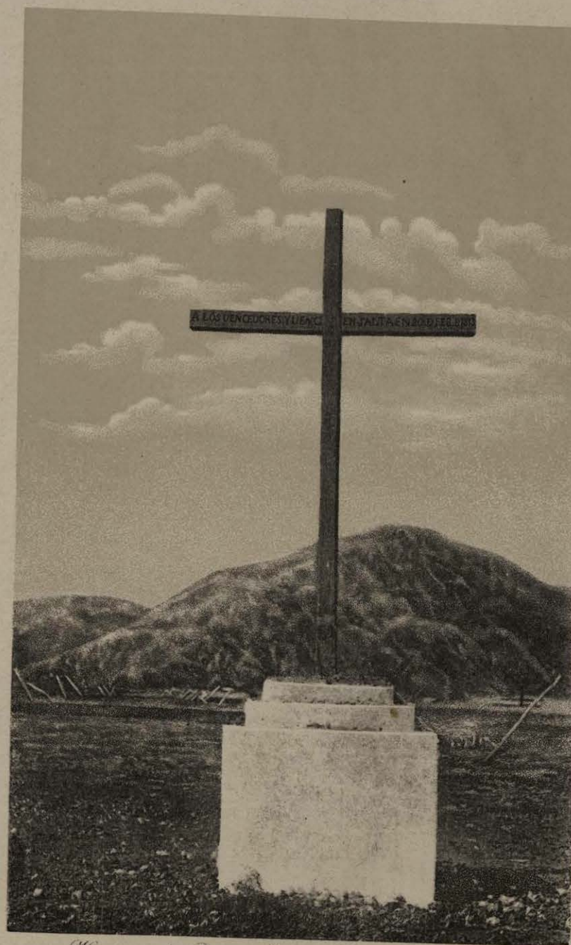
Historia de los Premios Militares - Republica Argentina.