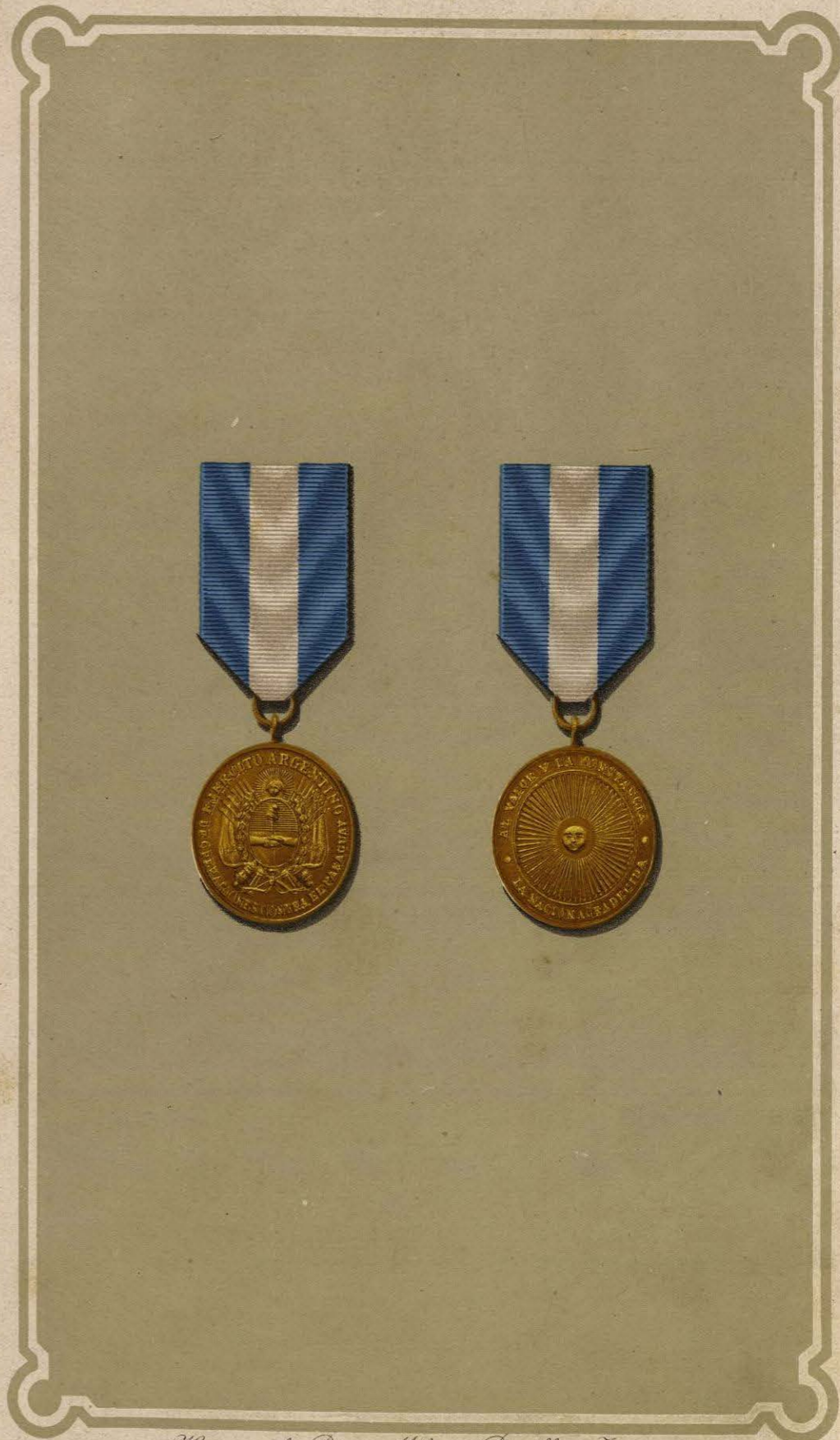
Historia de los Premios Militares República Argentina.

Art. 6º Queda autorizado el Poder Ejecutivo para determinar la clase de medallas acordadas por el artículo primero, así como para hacer los gastos que demanda la ejecucion de esta ley.