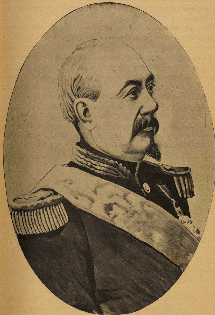
Francisco Aquiles Bazaine, Mariscal de Francia, sucesor del Mariscal Forey en el mando del ejército francés intervencionista (1863-1867). Sitió personalmente en Oaxaca al Gral. Díaz. Al rendirse éste por falta de elementos, le felicitó Bazaine porque no seguiría "haciendo armas contra su Soberano," á lo que respondió el Gral. Díaz: YO NO HE TENIDO NI TENGO MAS SOBERANO QUE EL PUEBLO MEXICANO.

Por desgracia, en México domina un concepto total y peligrosa-