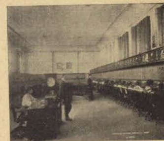
Empresa de Teléfonos Ericsson.