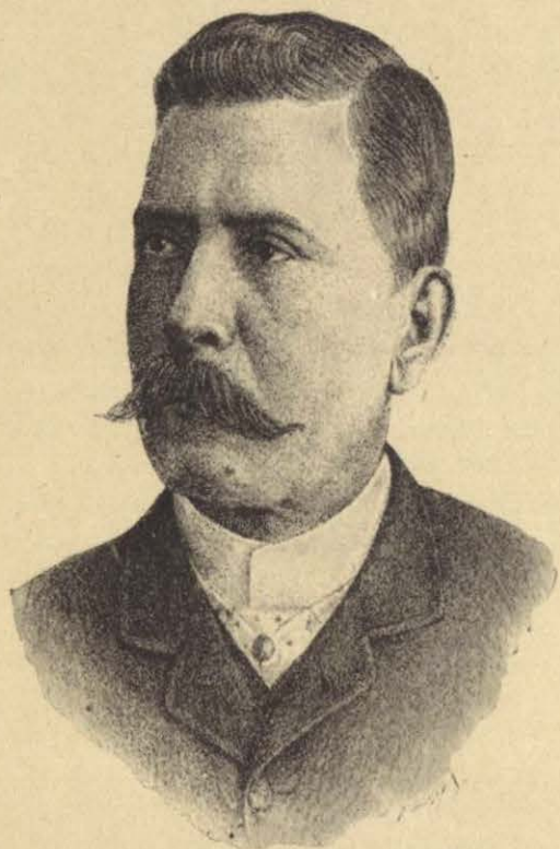
GENERAL PORFIRIO DIAZ EN 1886.