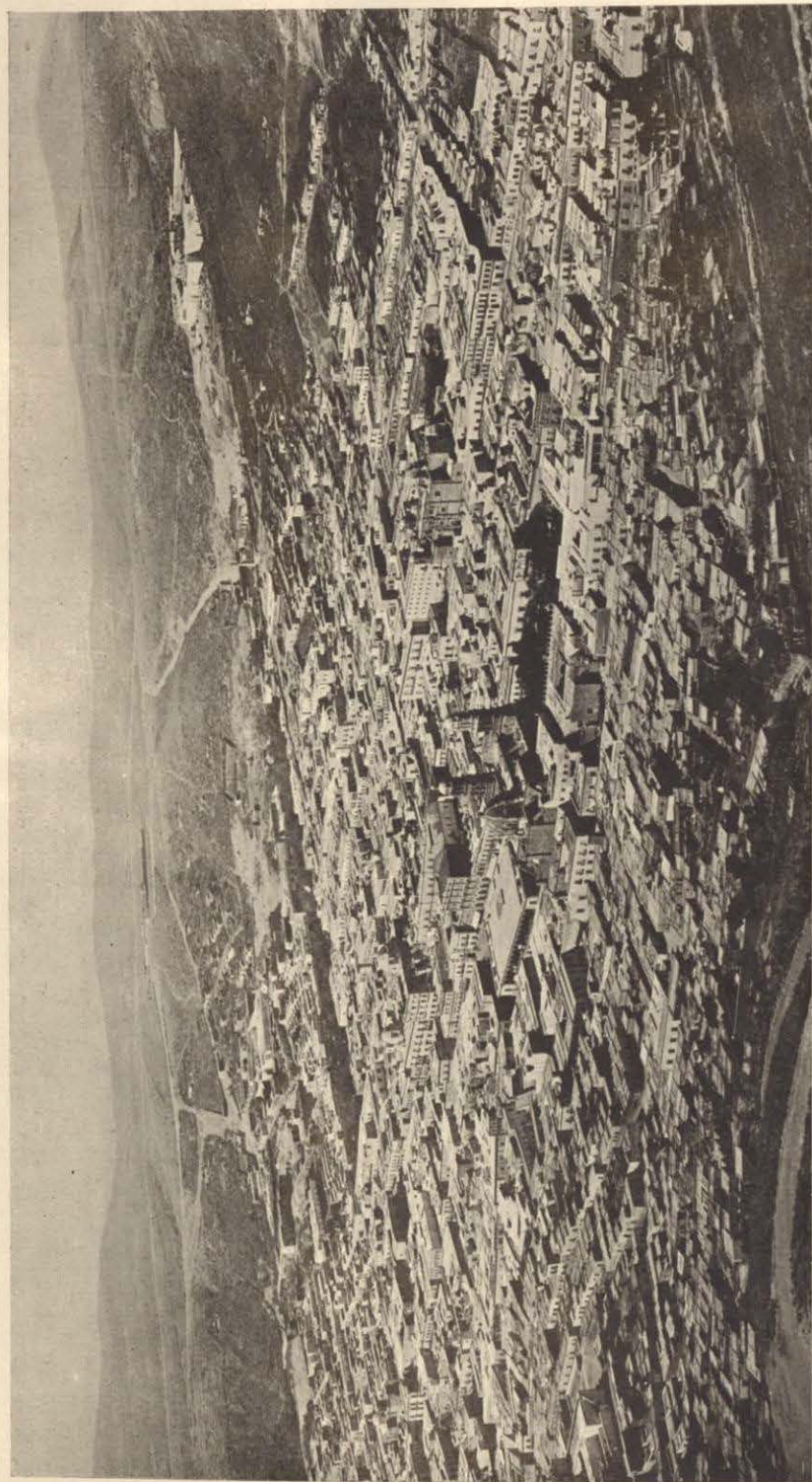
CIUDAD DE ZACATECAS, ESTADO DE ZACATECAS — ESTADO ACTUAL.

Preguntado Si ha handado con los Exercitos del Cura, si ha concurrido en algun saquéo, que le ha tocado, desde Quando esta en Zacatecas, y con que objeto vino, Dixo: que no ha serbido en ningun Exercito, q. e no ha sido Ynsurgente, y por consiguiente no ha concurrido á ningun saqueo ni le ha tocado nada; que bino á Zacatecas,