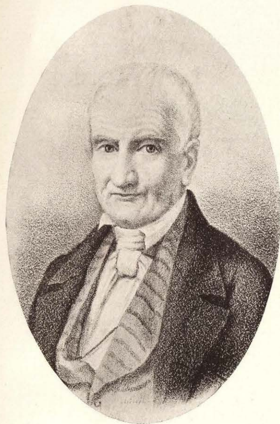
LIC. D. CARLOS MARIA DE BUSTAMANTE.