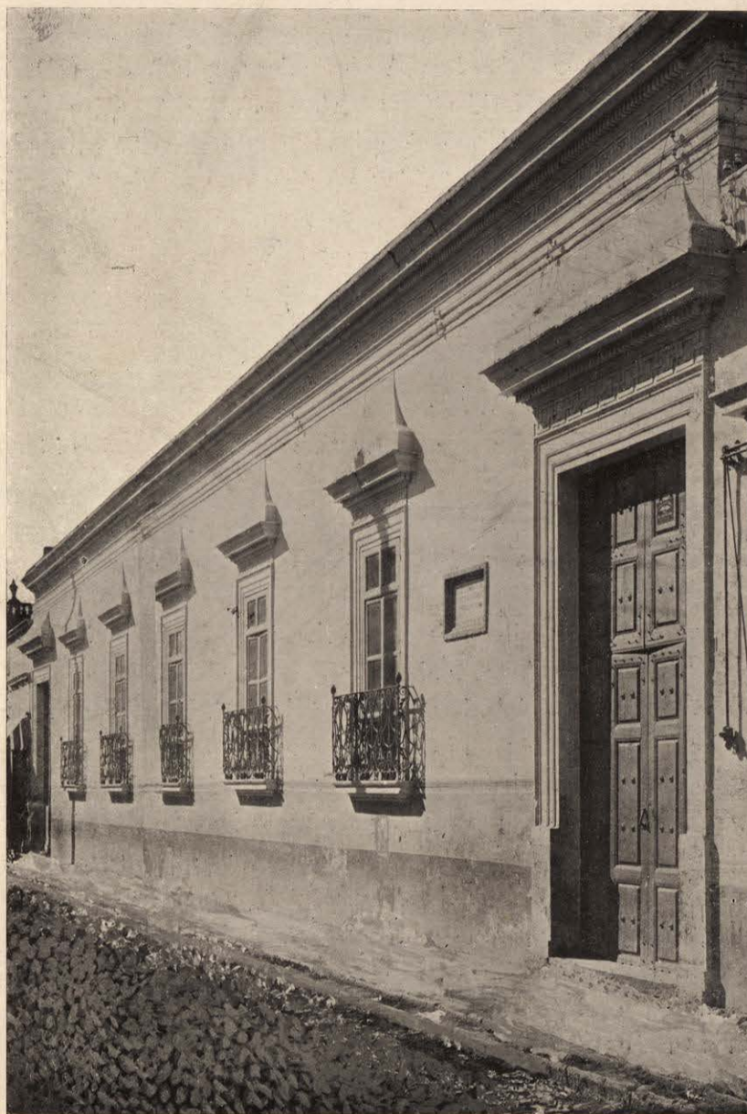
CASA DE D. JOAQUIN DE ITURBIDE, DONDE NACIO EL EMPERADOR AGUSTIN, SITUADA EN LA CALLE DE ITURBIDE DE LA CIUDAD DE VALLADOLID, HOY MORELIA, ESTADO DE MICHOACAN.—ESTADO ACTUAL.