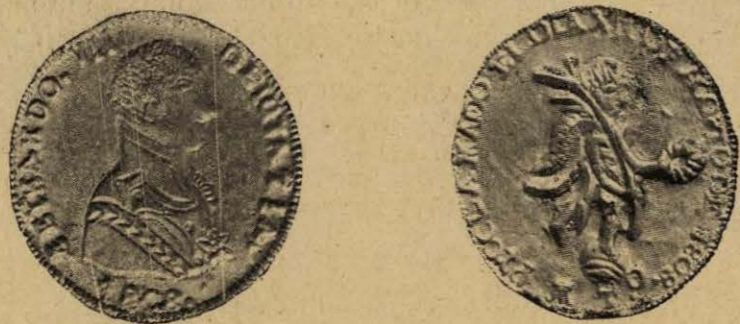
Plata fundida. Colección Medina. Rosa, ns. 28 y 29.

Anv. y rev. con gráficas de pequeños puntos.