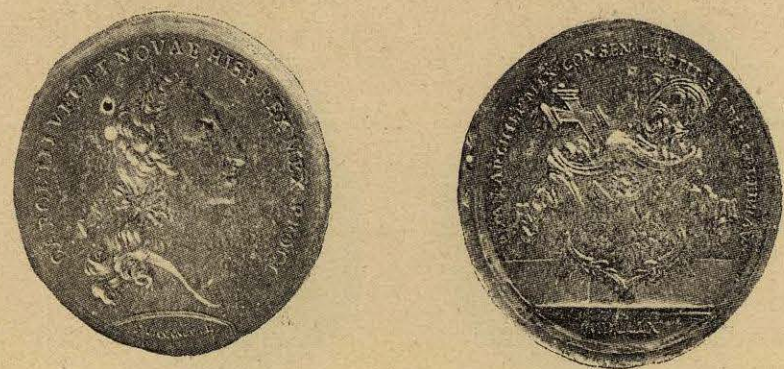
Plata. Colección Medina.

Anv. y rev. con gráficas de dobles líneas.