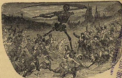
El vacío que cada dia dejaba la muerte.

El vacío que cada dia dejaba la muerte en aquella deplo-