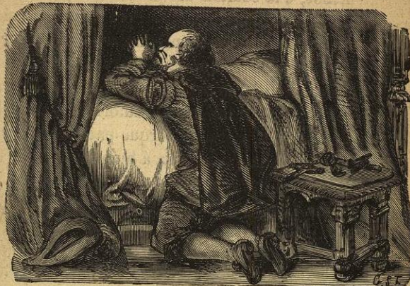
Aquel tirano tan famoso mudó enteramente de vida.

esta historia. ¿Y quién sabe si algun curioso que tuviese habilidad y deseo de hallarla, encontraria en aquel valle alguna