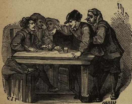
Llamaban para que le mirasen.

Al pronunciar estas palabras, bajó la cabeza y estuvo algun tiempo como pensativo y cavilando; dió luego un suspiro. y levantó la cabeza con ojos encandilados, y tan decaído, que hubiera sido lástima que le hubiese visto la persona que ocupaba entónces su imaginacion; pero aquella