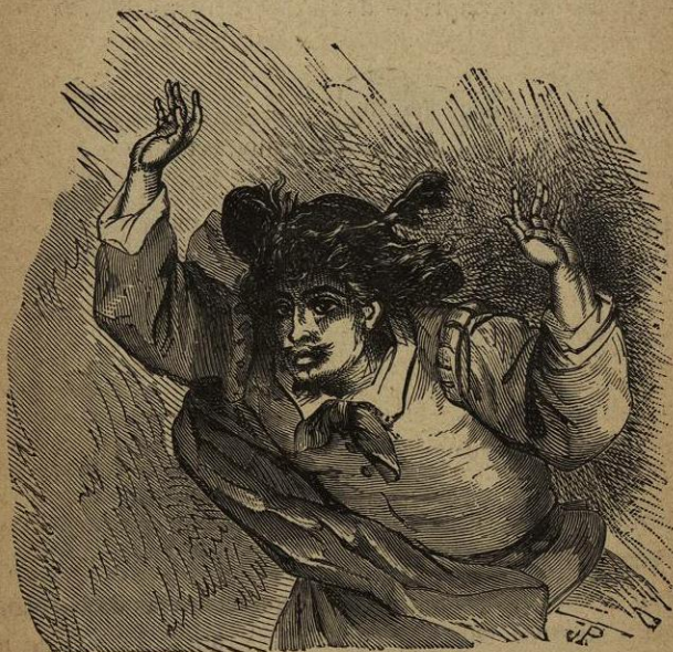
No tardó en conseguir el verse fuera de aquella apretura.

y sólo tratan de meterse entre la muchedumbre para escurrirse sin ser notados. Deseaba el Escribano hacer lo mismo, pero le vendia la capa negra. El pobre diablo, con la cara descolorida y el corazon encogido, procuraba achicarse haciendo esguinces para salir de aquella apretura, pero no podía levantar la vista, sin verse á lo ménos veinte brazos en-