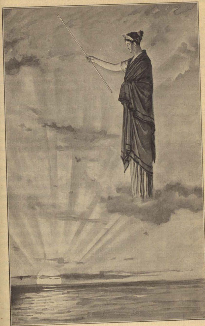
JUNO OBLIGÓ AL SOL Á HUNDIRSE, MAL DE SU GRADO, EN LA CORRIENTE DEL OCÉANO. (Canto XVIII, versos 239 y 240.)

202 En diciendo esto, fuése Iris, ligera de pies. Aquiles, caro á Júpiter, se levantó, y Minerva cubrióle los fornidos hombros con la égida floqueada y circundóle la cabeza con aurea nube, en la cual