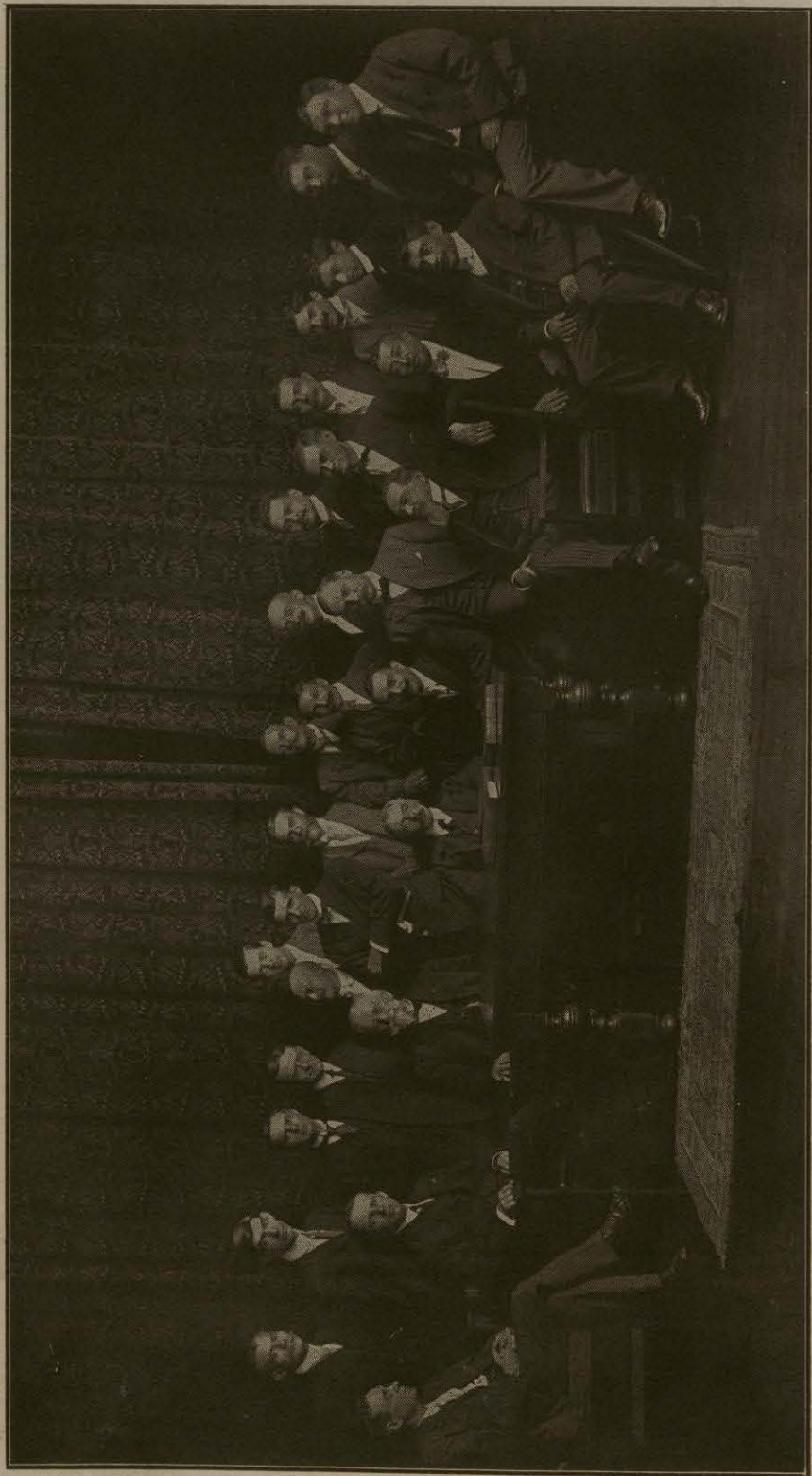
Personal de la Comisión de Arbitraje y de las Agencias de ambos Gobiernos

COMISIÓN INTERNACIONAL DE LÍMITES ENTRE MÉXICO Y LOS ESTADOS UNIDOS.