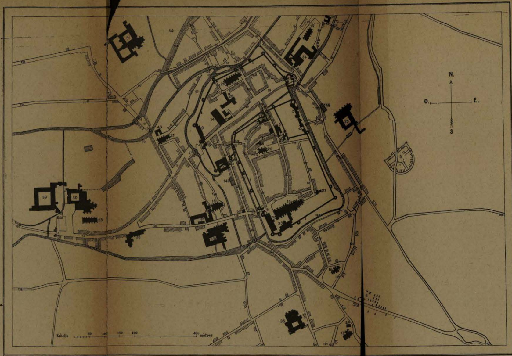
PLAN DE LA VILLE D'ÉVREUX EN 1745