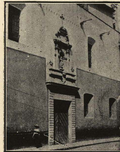
CONVENTO DE JESÚS MARÍA (Fachada)

UNIVERSIDAD DE GUAYMAS BIBLIOTECA UNIVERSITARIA "ALFONSO DIEZ" 125 1925