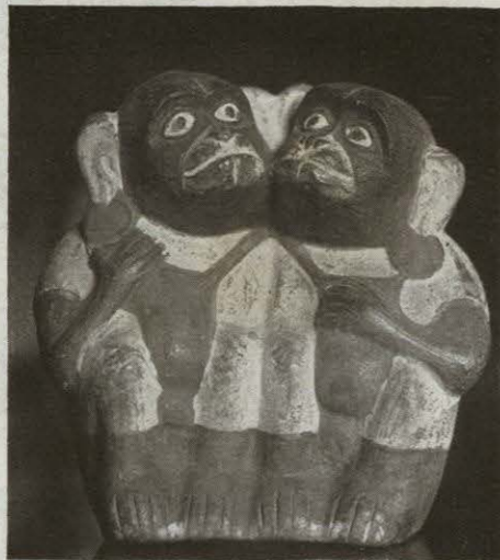
Fig. 827.—Grupo de cerámica. PERÚ.