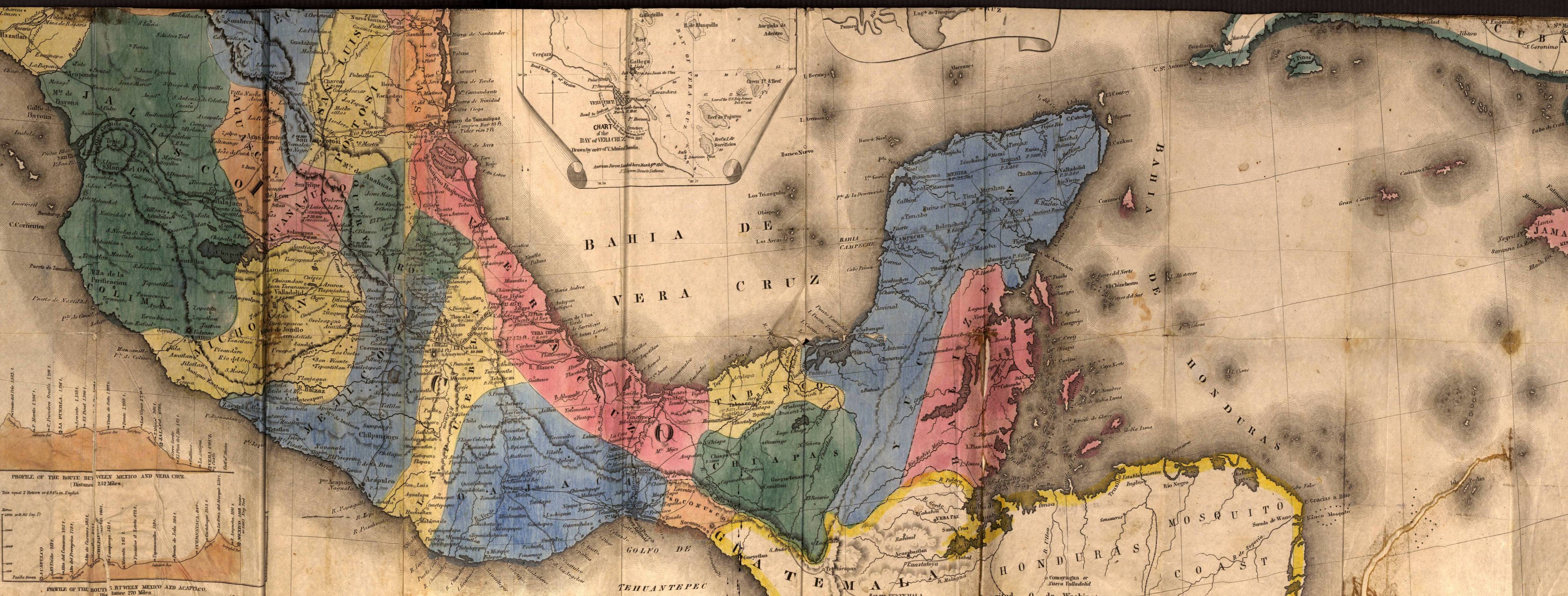
CHART OF THE BAY OF VERA CRUZ. Drawn by order of Captain Borden.

American Bureau Land and Sea Chart No. 100.