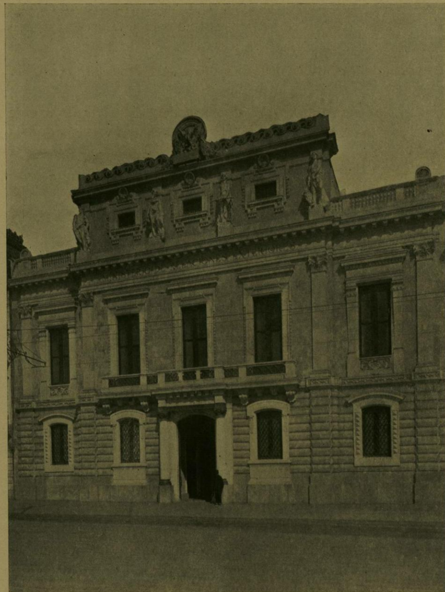
SECRETARIA DE RELACIONES EXTERIORES.