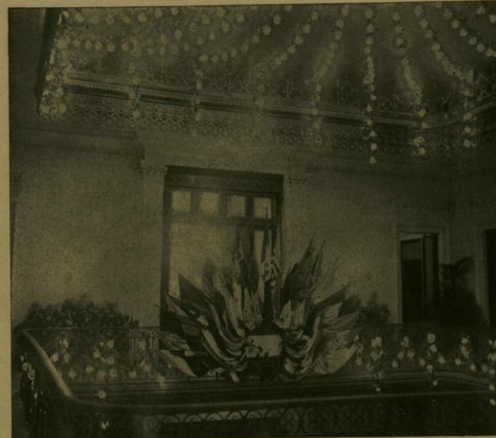
ADORNO DE LOS CORREDORES ALTOS DEL PRIMER PATIO DE LA SECRETARIA DE RELACIONES.

El patio quedó convertido en elegante hall , con una gran jardinera en el centro, llena de azaleas y begonias, y bajo una cúpula de hortensias y verdes guías que servía de techo al salón. Llenaban artísticamente los cuatro ángulos de éste, plantas de invernadero; el costado izquierdo estaba ocupado por la plataforma destinada á la orquesta, y el frente de la entrada ostentaba un soberbio trofeo con el escudo nacional en el centro y los pabellones de todas las Naciones amigas de México alrededor.