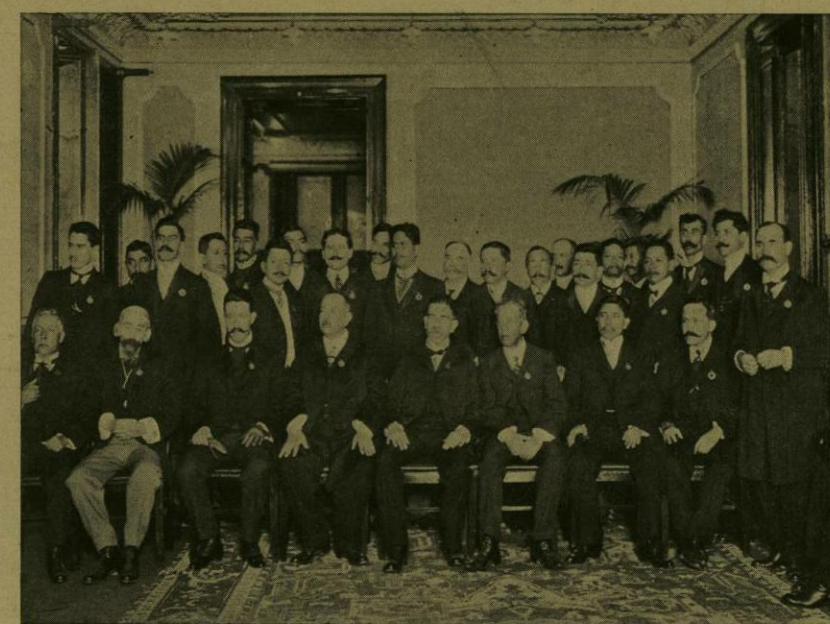
OTRO GRUPO DE CONCURRENTES A LA RECEPCION DE CONGRESISTAS PEDAGOGICOS.

mada por distinguidas damas de suprema elegancia y caballeros uniformados de toda gala, con condecoraciones y entorchados, ó vistiendo el severo traje de etiqueta. El señor Presidente de la República y su digna esposa concurrieron á la reunión y permanecieron en ella durante largo rato, cumplimentados por los señores don Guillermo de Landa y Escandón, Gobernador del Distrito Federal, y don Fernando Pimentel y Fagoaga, Presidente del Ayuntamiento, y por sus esposas.