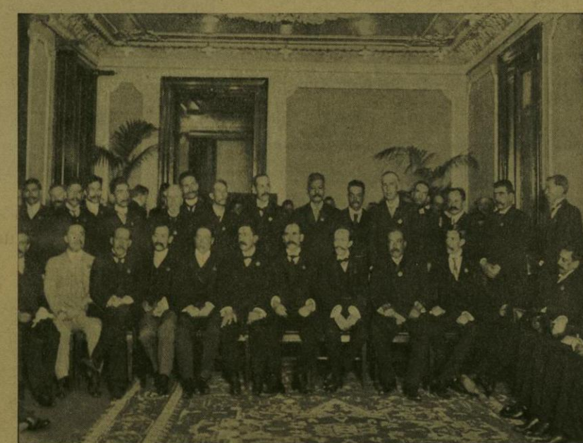
EL SR. SUBSECRETARIO DE INSTRUCCION PUBLICA RODEADO POR CONGRESISTAS PEDAGOGICOS.