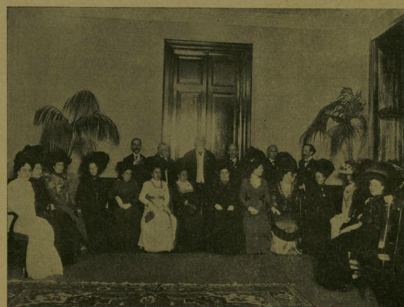
EL SR. SECRETARIO DE INSTRUCCION PUBLICA RODEADO POR CONGRESISTAS PEDAGOGICOS.

La fiesta comenzó á las 9 p. m., y pocos momentos después los salones estaban llenos de selecta concurrencia, for-