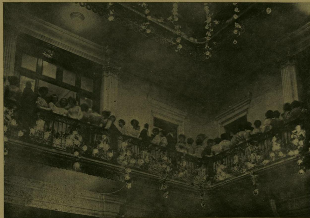
CONCURRENTES A LA RECEPCION DE LA SECRETARIA DE RELACIONES.