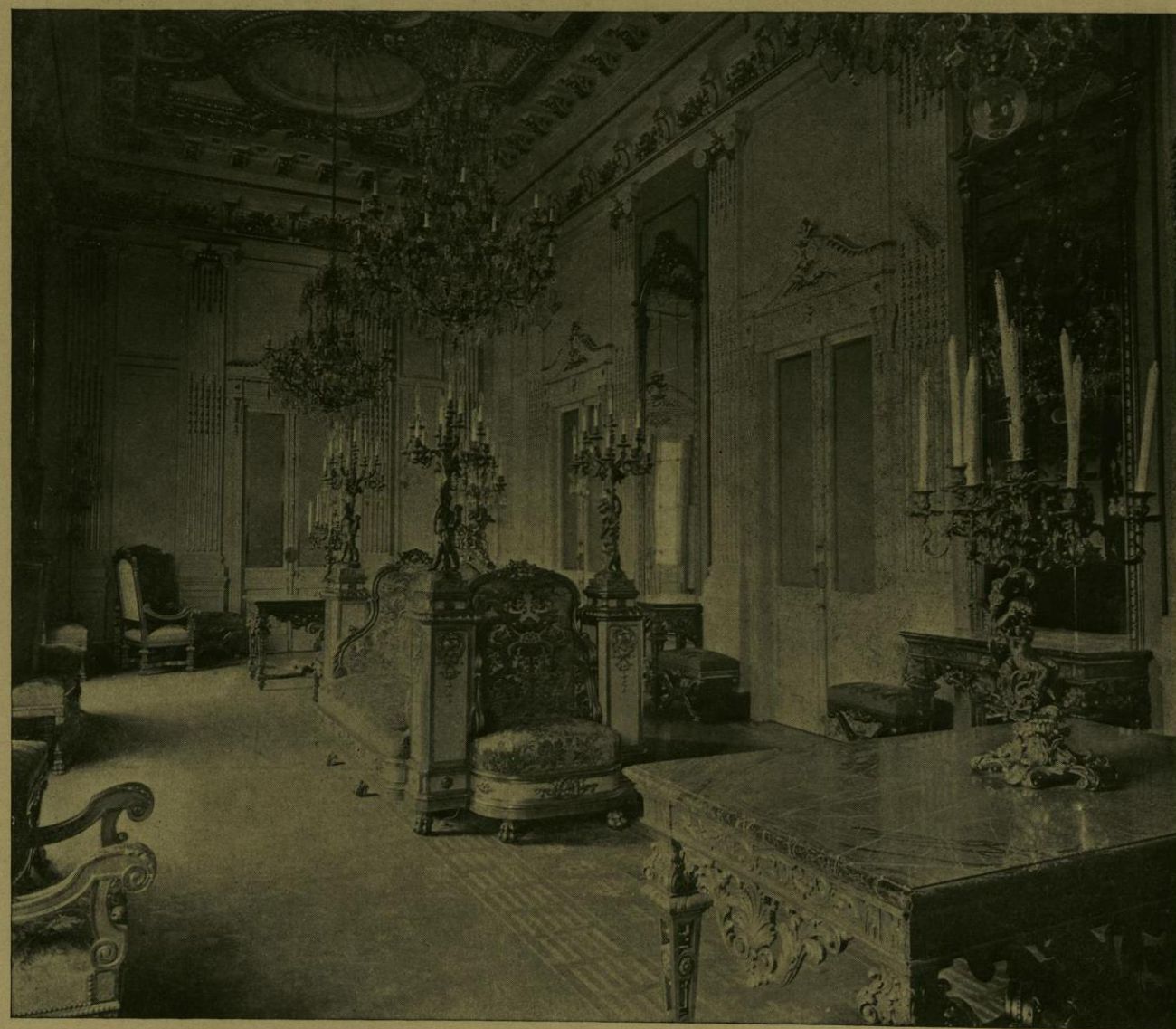
OTRA VISTA DEL GRAN SALON DE RECEPCIONES DE LA SECRETARIA DE RELACIONES.

Traspuesto el vestíbulo, se llegaba al hall , adornado con exquisito gusto, elegantes muebles del siglo XVIII, porcelanas valiosas, auténticas lunas venecianas, pinturas encuadradas en marcos de talla, y otras obras admirables, debidas al genio creador de los artifices de pasados siglos. A la izquierda del hall , en el patio central del Palacio, se arregló el salón principal, cuya magnífica arquitectura resaltaba á la luz de la féérica iluminación, y en el