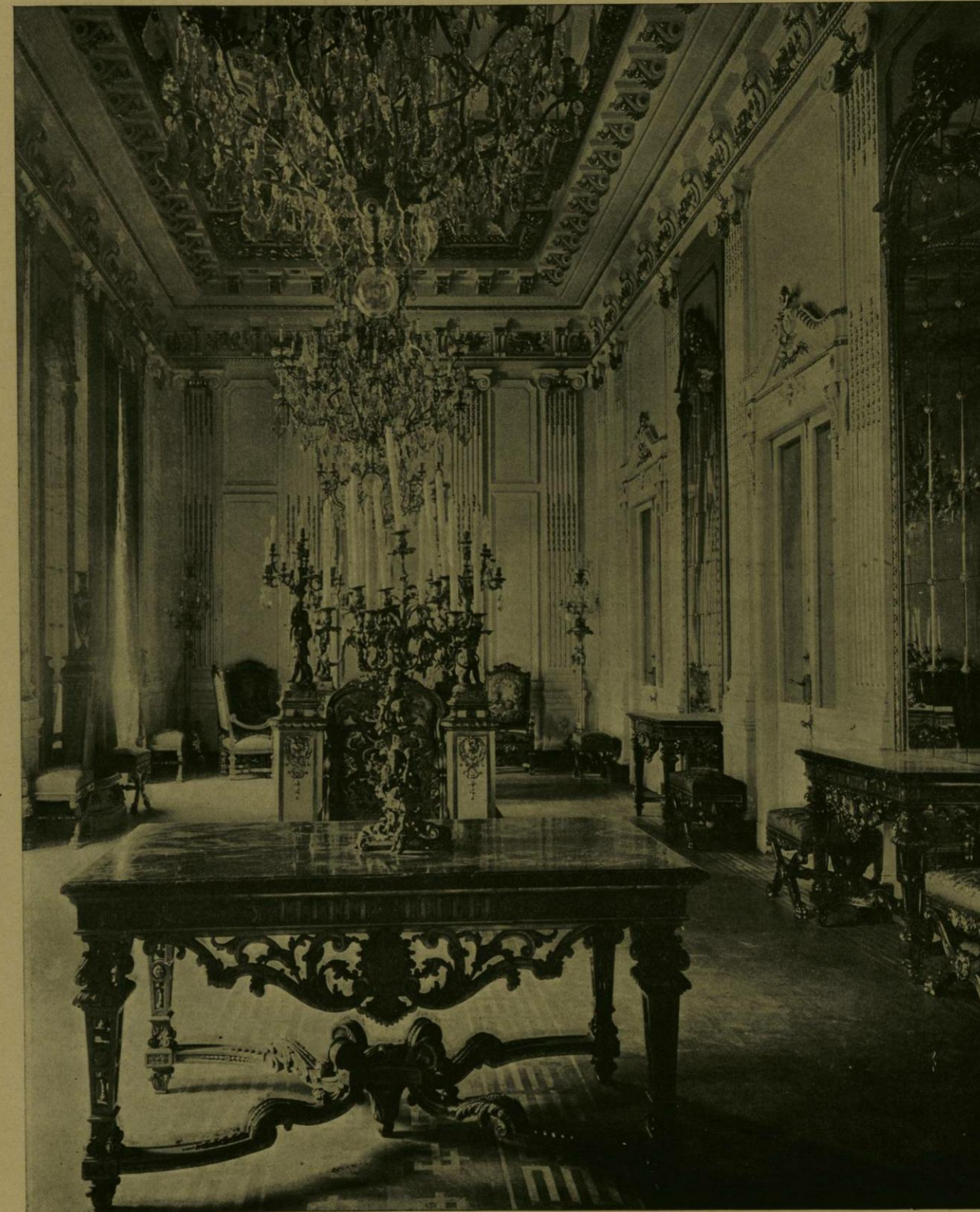
UNA VISTA DEL GRAN SALON DE RECEPCIONES DE LA SECRETARIA DE RELACIONES.

El señor Secretario de Relaciones y la señora su esposa hicieron los honores de la fiesta de una manera extraordinariamente amable. Entre los numerosos invitados se encontraban las damas más distinguidas y las señoritas más hermosas, con espléndidos trajes y magníficos tocados; los señores Embajadores, Enviados Especiales, Ministros Plenipotenciarios, Delegados y miembros de Legaciones Extranjeras, brillantemente uniformados; los Ministros Mexicanos y los altos funcionarios federales, y los representantes más conspicuos de la banca, el comercio, la aristocracia y la industria, casi todos con sus familias, tan lujosamente vestidas, que la inauguración del edificio de Relaciones quedará por mucho tiempo en el recuerdo de cuantos á ella asistieron, como un triunfo de la elegancia, de la distinción y del gusto más refinados.