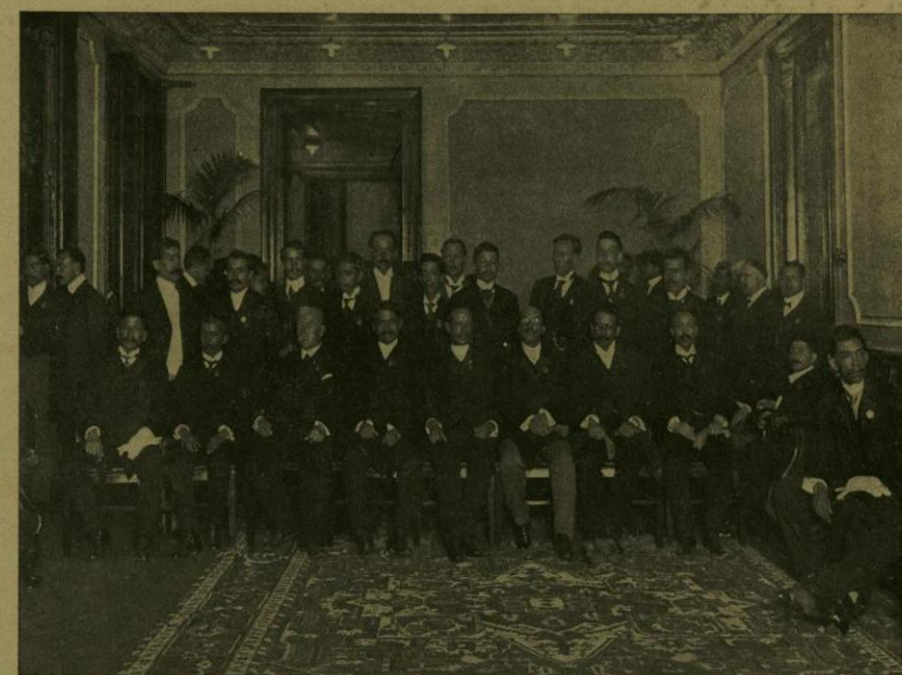
GRUPO DE CONCURRENTES A LA RECEPCION DE CONGRESISTAS PEDAGOGICOS.

En uno de los costados del salón principal quedaron instalados los comedores, cuyo