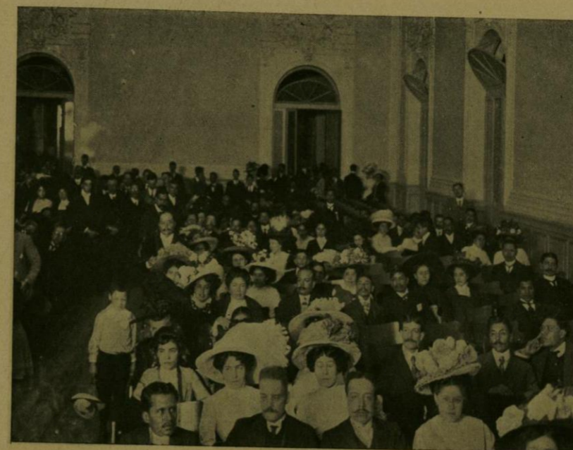
ASPECTO DEL SALON DONDE SE EFECTUO LA APERTURA DEL CONGRESO DE EDUCACION.