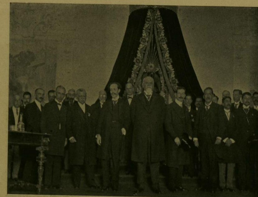
EL SR. MINISTRO DE INSTRUCCION PUBLICA Y VARIOS MIEMBROS DEL CONGRESO DE EDUCACION.