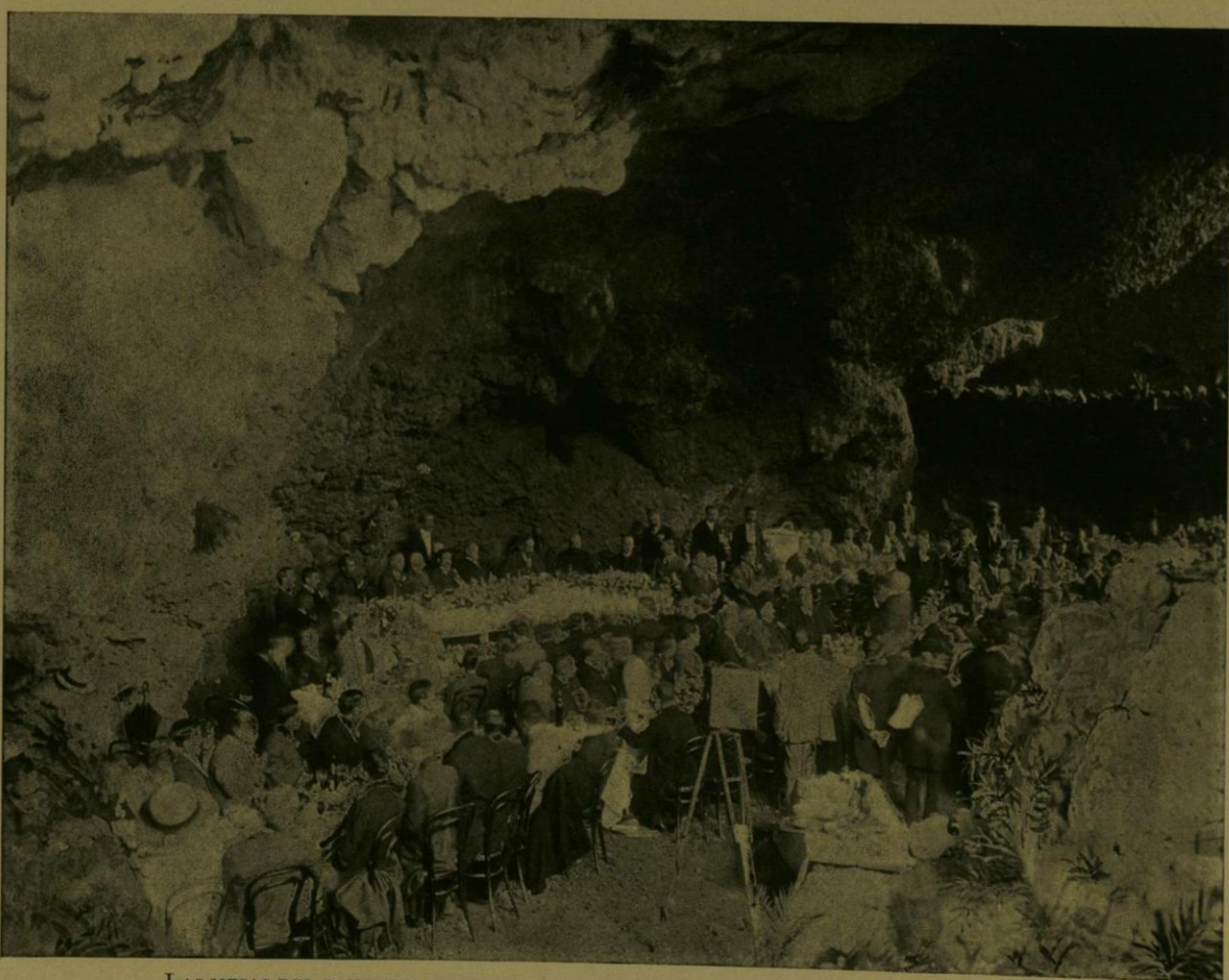
LAS MESAS DEL BANQUETE OFRECIDO A LOS AMERICANISTAS EN LA GRUTA «PORFIRIO DIAZ.»