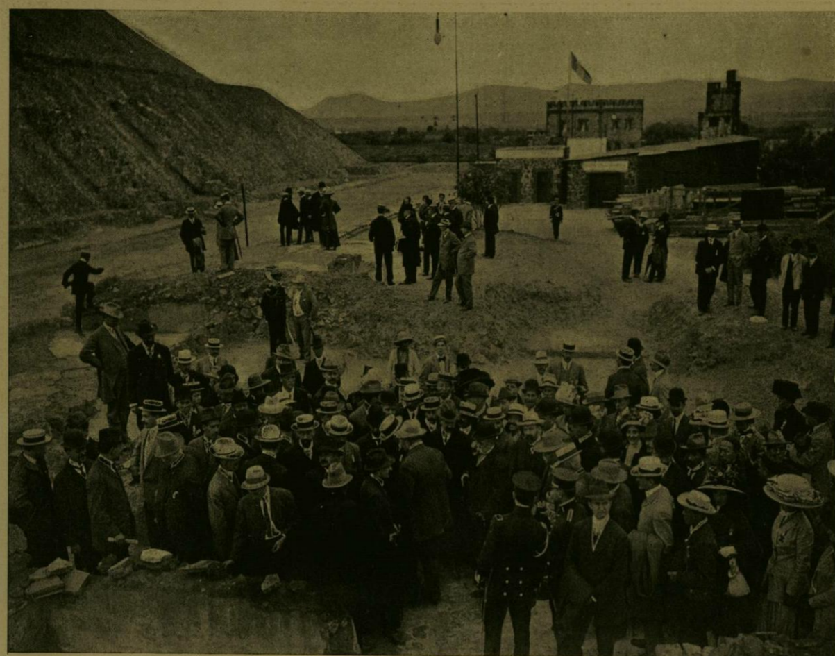
LOS AMERICANISTAS EXAMINAN DIVERSOS OBJETOS ARQUEOLOGICOS EN SAN JUAN TEOTIHUACAN.

Terminada la visita, la concurrencia se dirigió á la gruta «Porfirio Díaz», en donde estaba preparado el banquete con que la Secretaría de Instrucción Pública obsequió á los señores americanistas y á los demás invitados. A la mesa, adornada con elegancia y servida por uno de los mejores restaurants de la Capital, tomaron asiento, en los lugares de honor, los señores Secretarios de Relaciones Exteriores y de Instrucción Pública; los Excelentísimos señores Curtis Guild (jr.), Barón Yasuya Uchida, Chang Ying Tang y Marqués de Polavieja, y varios señores Jefes de Misiones Ex-