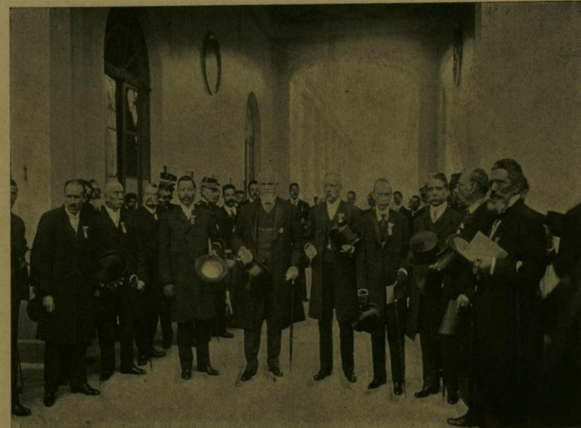
EL SR. MINISTRO DE INSTRUCCION PUBLICA Y VARIOS MIEMBROS DEL CONGRESO MEDICO.

morar dignamente el Centenario, el interesante grupo de educadores de la niñez, por iniciativa é invitación de la Secretaría de Instrucción Pública y Bellas Artes, celebró un Congreso Pedagógico, que dió principio á sus labores el día 13 de septiembre, fecha en que fué solemnemente inaugurado por el señor Secretario del ramo.