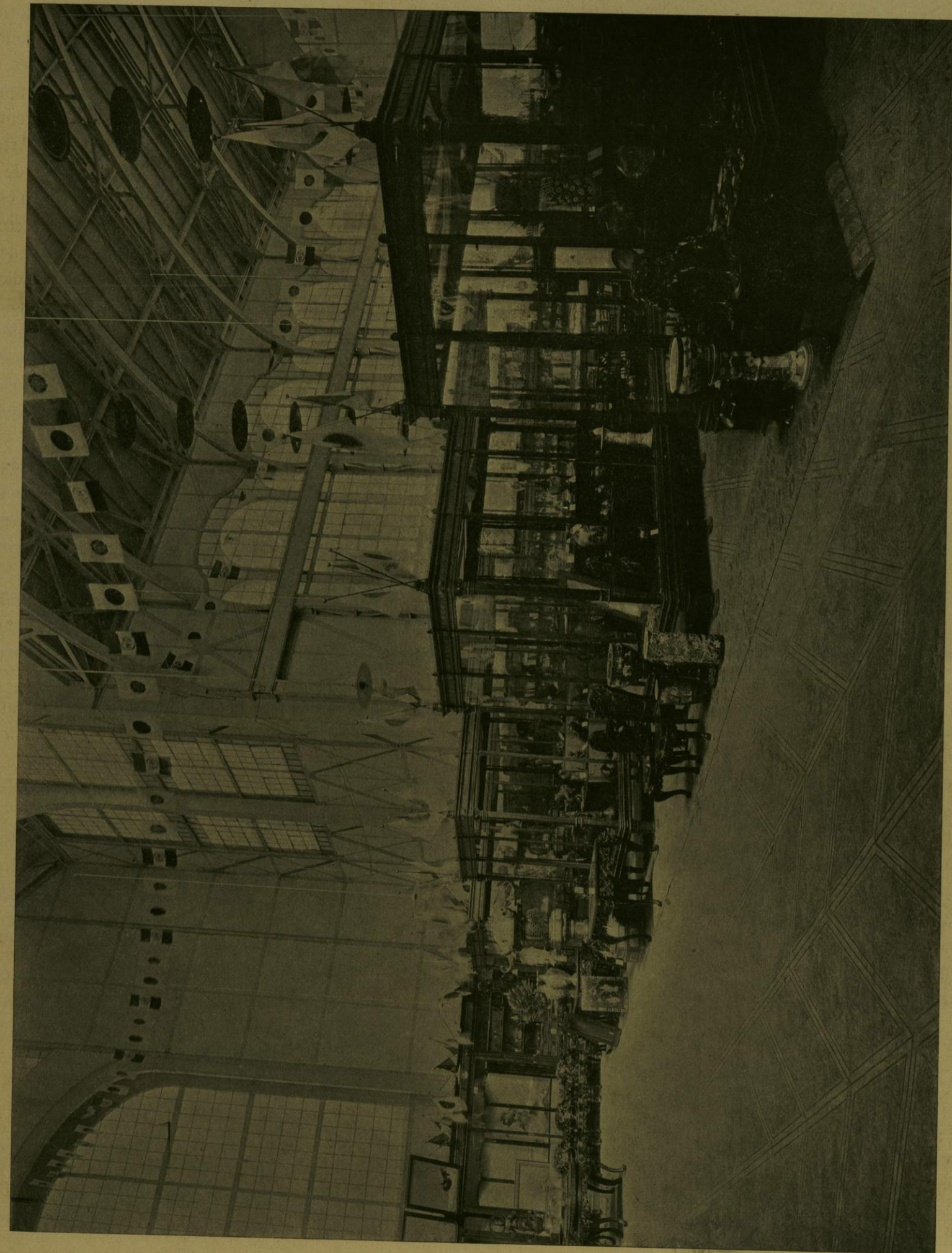
VISTA INTERIOR NOROCCIDENTE DE LA EXPOSICION JAPONESA.