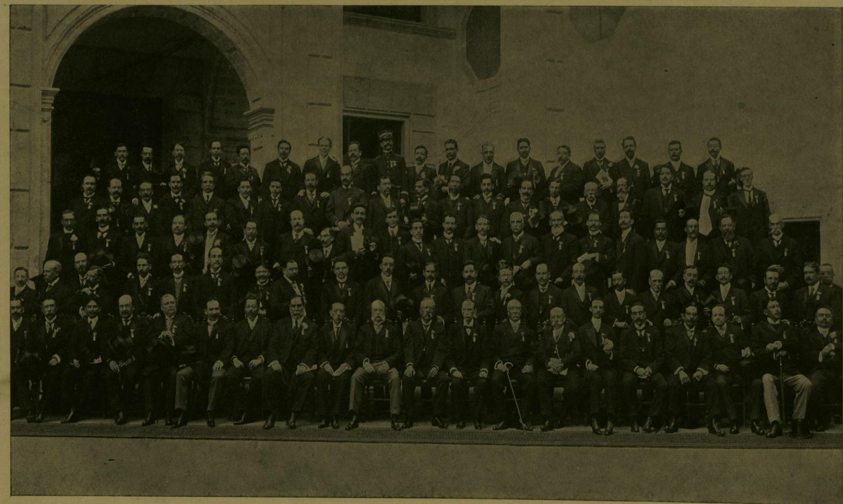
MIEMBROS DEL CONGRESO MEDICO.