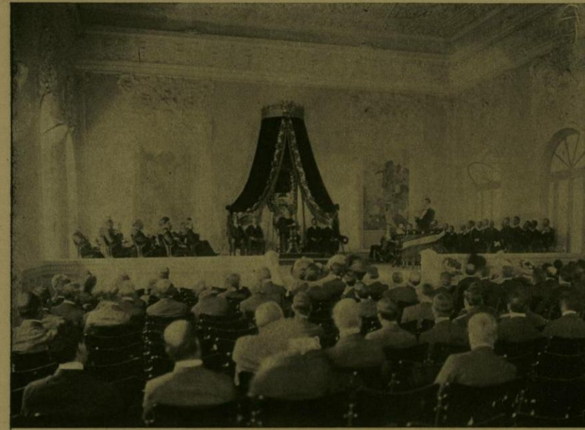
EL ACTO DE LA APERTURA DEL CONGRESO MEDICO.