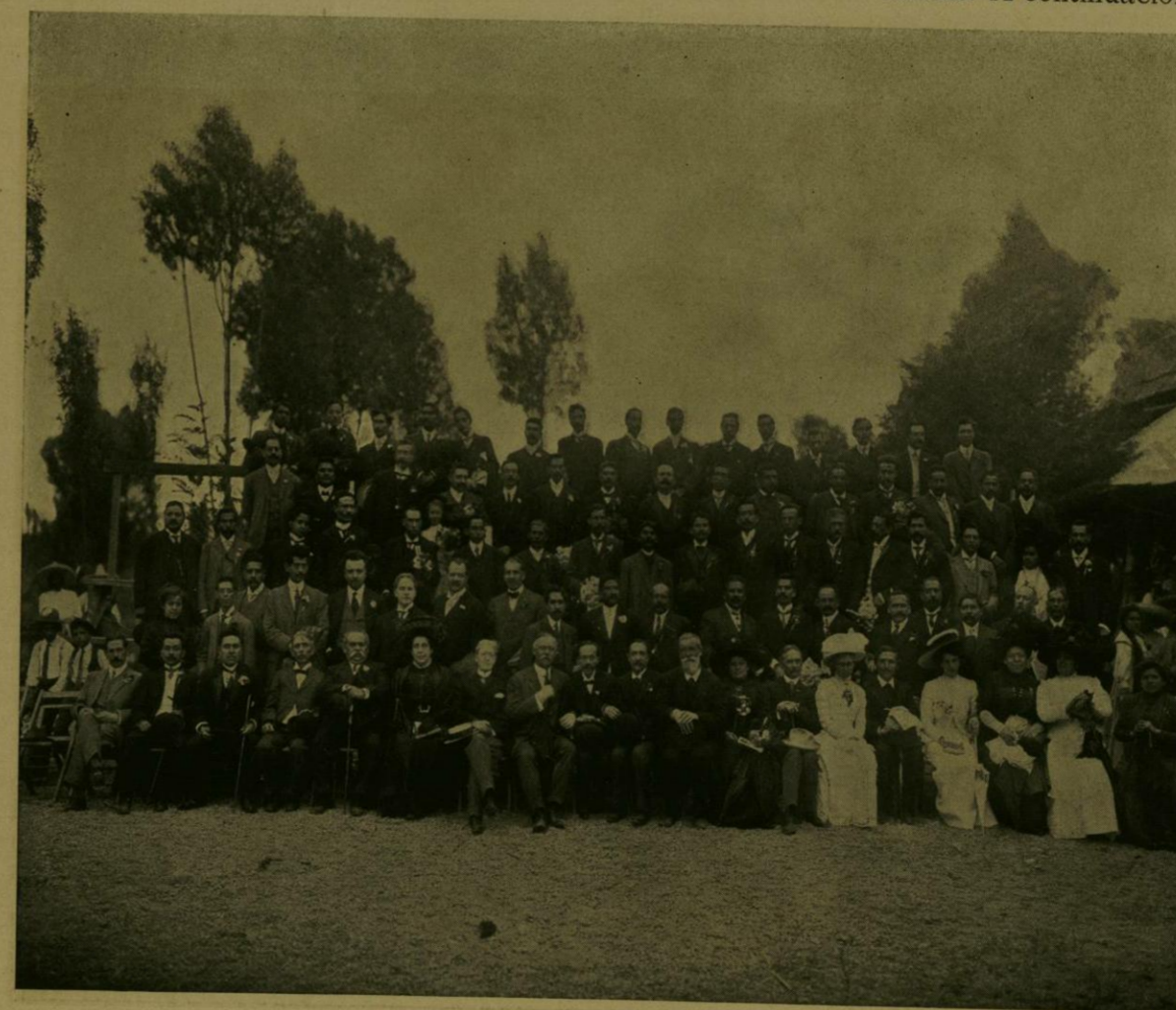
MIEMBROS DEL CONGRESO DE EDUCACION.

Primer Congreso Nacional de Educación Primaria.—Para conme-