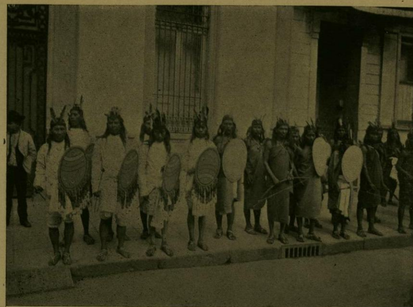
DESFILE HISTORICO.—FLECHEROS MEXICANOS.