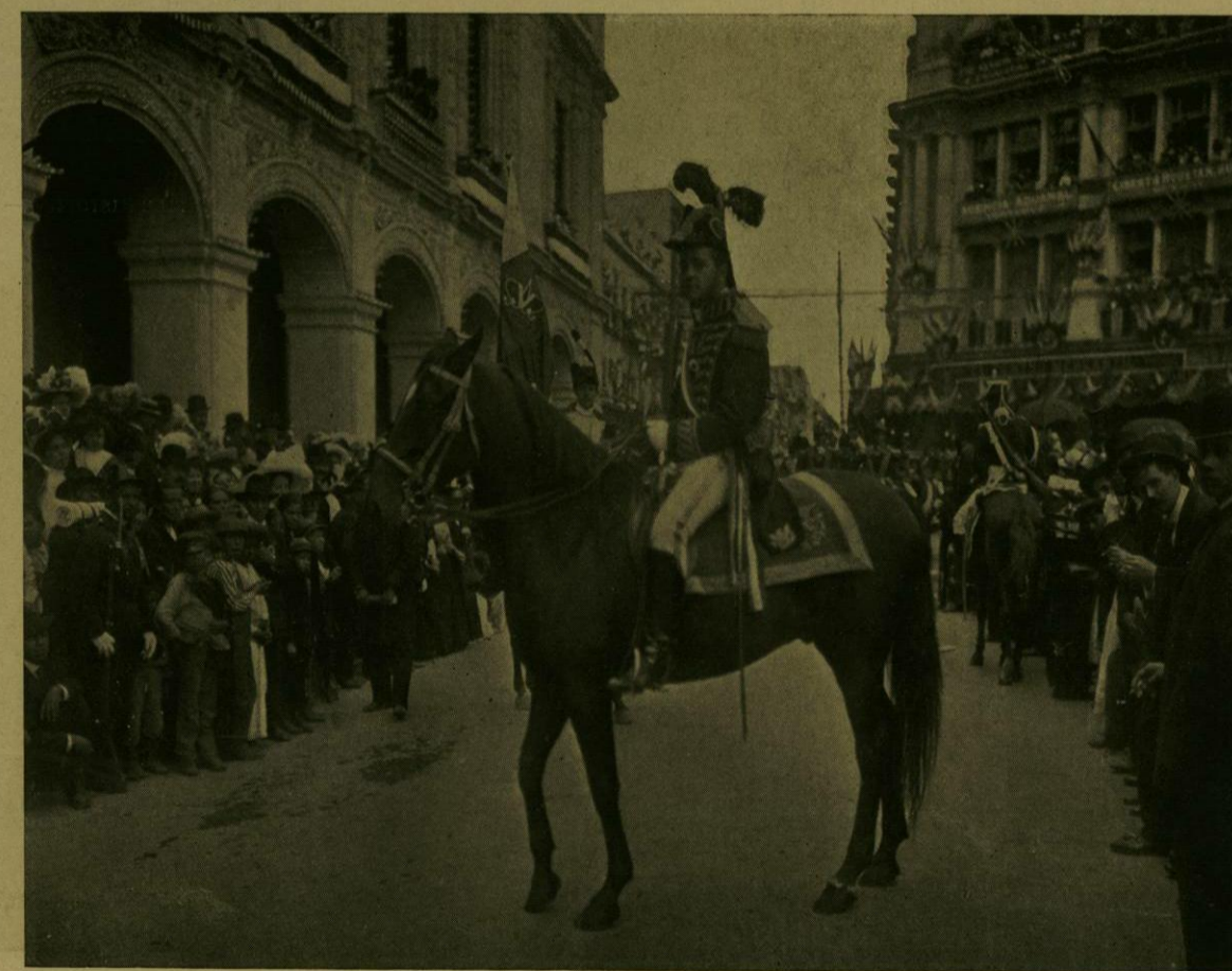
DESFILE HISTORICO.—D. AGUSTIN DE ITURBIDE.

Homenaje de los mecánicos y ferrocarrileros á los héroes de la Independencia. —El día 17 de septiembre, se efectuó ante la Columna de la Independencia que se alza en el Paseo de la Reforma, una manifestación cívica organizada por los miembros del Comité de Mecánicos y Ferrocarrileros, bajo el patrocinio del Gobierno del Distrito Federal.