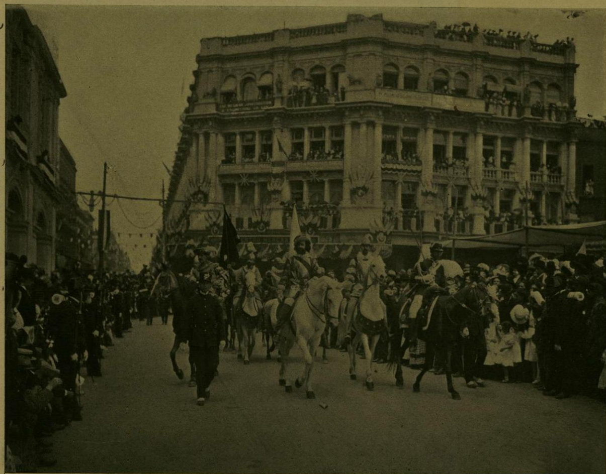
DESFILE HISTORICO.—HERNAN CORTES Y SUS CAPITANES.

Según él, en la procesión estarían representadas tres grandes épocas de la existencia nacional: la de la Conquista, la de la Dominación Española y la de la Independencia; para conseguirlo, se organizaron otros tantos cuadros que deberían figurar, el primero, la salida del Emperador Motecuhzoma al encuentro de Cortés; el segundo, el paseo del Pendón en los tiempos virreinales, y el último, la entrada en México del Ejército Trigarante, al mando de Iturbide. Además, quedarían incorporados á la procesión varios carros alegóricos.