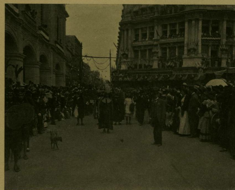
DESFILE HISTORICO.—GUERREROS TLAXCALTECAS.

cas, jefes de la República de Tlaxcala y porta-estandartes. En el segundo cuadro formarían doscientos ochenta y ocho personas con trajes adecuados, entre las que estarían el Virrey, los oidores de la Audiencia, los miembros del Ayuntamiento, los consejeros del Rey, el Alférez Real, los provinciales religiosos, los indios principales, gran número de militares y funcionarios civiles y muchos personajes de inferior categoría; y en el tercero, los Generales don Agustín de Iturbide, don Vicente Guerrero, don Manuel Mier y Terán, don Guadalupe Victoria y don Anastasio Bustamante; algunas secciones de las que formaron el Ejército Trigarante, entre ellas las de los regimientos de Granaderos Imperiales, de la Corona, de Celaya, de Tres Villas, de Guadalajara, de Querétaro, Ligeros de Morelos, Fijo de Puebla, de México y de Valladolid, de Santo Domingo, de Fernando VII, de Dragones de México, del Rey, de Santander, Fieles del Potosí y otros, así como varios carros alegóricos enviados por los Estados de la Federación.