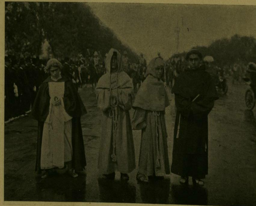
DESFILE HISTORICO.—LOS PROVINCIALES RELIGIOSOS Y LAS TROPAS DEL VIRREINATO.

El trayecto que se anunciaba recorrería, y recorrió efectivamente, el lucido cortejo, era el comprendido entre la Plaza de la Reforma y el Palacio Nacional, pasando, á la ida, frente al Portal de Mercaderes y al Palacio Municipal y, á la vuelta, por la Catedral y la Avenida del Cinco de Mayo.