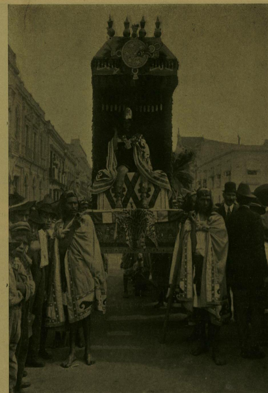
DESFILE HISTORICO.—EL EMPERADOR MOTECUHZOMA.

Al entrar en Catedral, los manifestantes se detenían un momento para depositar las flores y coronas que todos llevaban, ante el catafalco de los héroes, que en breves instantes quedó cubierto por ellas, y luego salían para volver á ocupar sus puestos de formación y desfilar frente al Palacio Nacional, en cuyo balcón central el señor Presidente de la República presenciaba el paso de la comitiva, acompañado por sus Secretarios de Estado y por los miembros de su Estado Mayor.