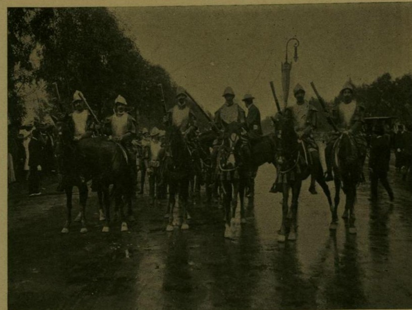
DESFILE HISTORICO.—ESCOPETEROS ESPAÑOLES.

La procesión del 14 de septiembre fué uno de los números mejor organizados del programa del Centenario y respondió ampliamente á sus altos fines de reverenciar á la patria en sus magnánimos libertadores.