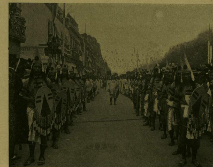
DESFILE HISTORICO.—GUERREROS MEXICANOS.