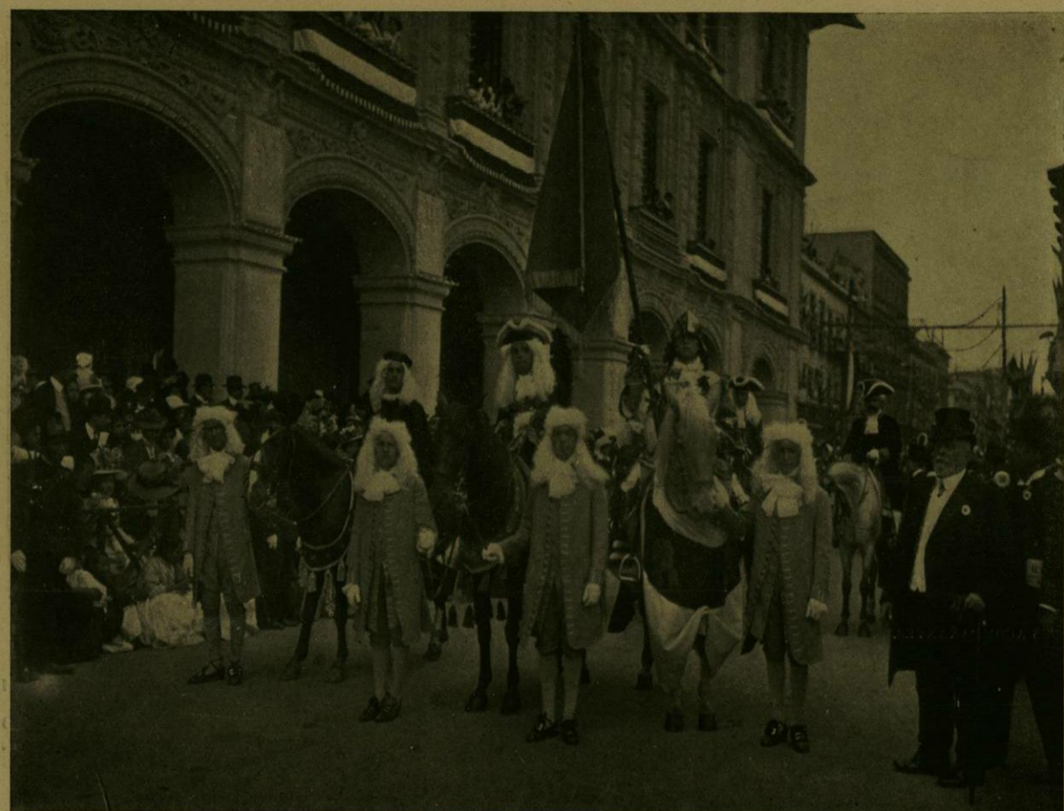
DESFILE HISTORICO.—EL OIDOR DECANO, EL VIRREY Y EL ALFÉREZ REAL.

A las 10 a. m. en punto, se inició la marcha de la comitiva, que encabezaba el grupo numeroso del Emperador Motecuhzoma y su séquito, notable por la brillantez y riqueza de sus trajes, armas, distintivos é insignias. Iba el Monarca Azteca en andas sostenidas por varios nobles, cubierto por un palio y seguido de sus vasallos; lo rodeaban guerreros armados con macanas, arcos, flechas y lanzas, ó portadores de estandartes de pluma, y nobles indias escogidas entre los tipos más puros de la raza. El conjunto resultaba original y, además, noble, por lo que arrancaba, á su paso, ruidosos aplausos. Al llegar frente al Palacio Nacional, en cuyos balcones se encontraban el señor Presidente de la República con sus Secretarios de Estado, los Representantes Especiales Extranjeros, los miembros del Cuerpo Diplomático Permanente y las más distinguidas familias de la Capital, el grupo mexicano hizo alto para esperar al español, que avanzaba á su encuentro al mando de Cortés.