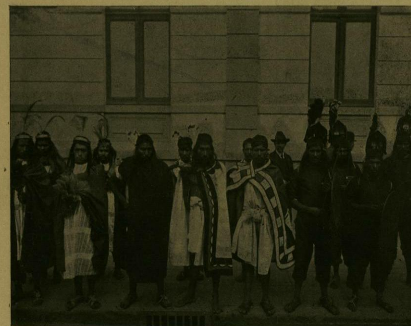
DESFILE HISTORICO.—NOBLES Y SOLDADOS MEXICANOS.