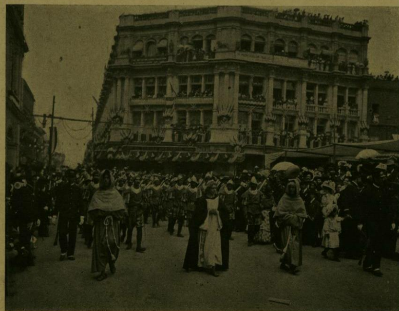
DESFILE HISTORICO.—LOS PROVINCIALES RELIGIOSOS.

Abrían la marcha de este último grupo varios escopeteros; seguían atambores, clarines y ballesteros á pie y á caballo, entre los que se veía á un guerrero que llevaba un estandarte negro con una cruz roja en el centro, rodeada por una inscripción que decía: «Con la cruz y esta enseña venceremos.» Aparecía luego Hernán Cortés con traje de terciopelo acuchillado de blanco, sobre brioso corcel y rodeado por Alvarado, Avila, Velásquez de León, Ordaz, Sandoval, Díaz del Castillo y otros conquista-