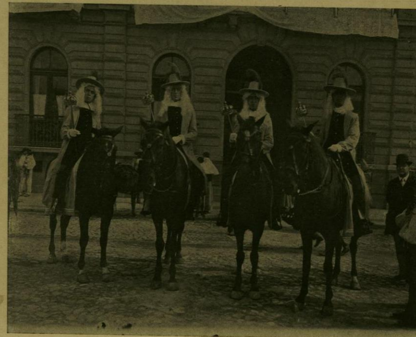
DESFILE HISTORICO.—LOS MACEROS DEL AYUNTAMIENTO.