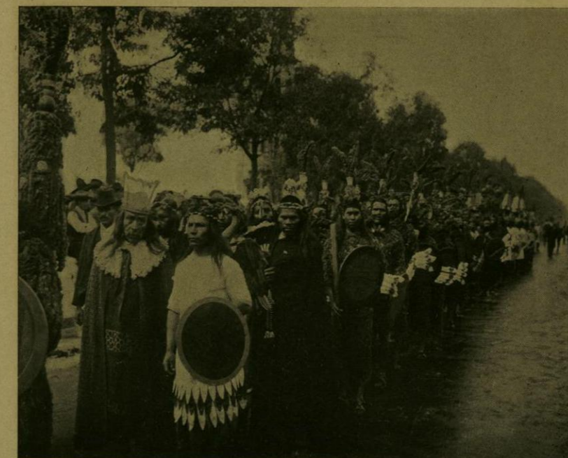
DESFILE HISTORICO.—GUERREROS TLAXCALTECAS.