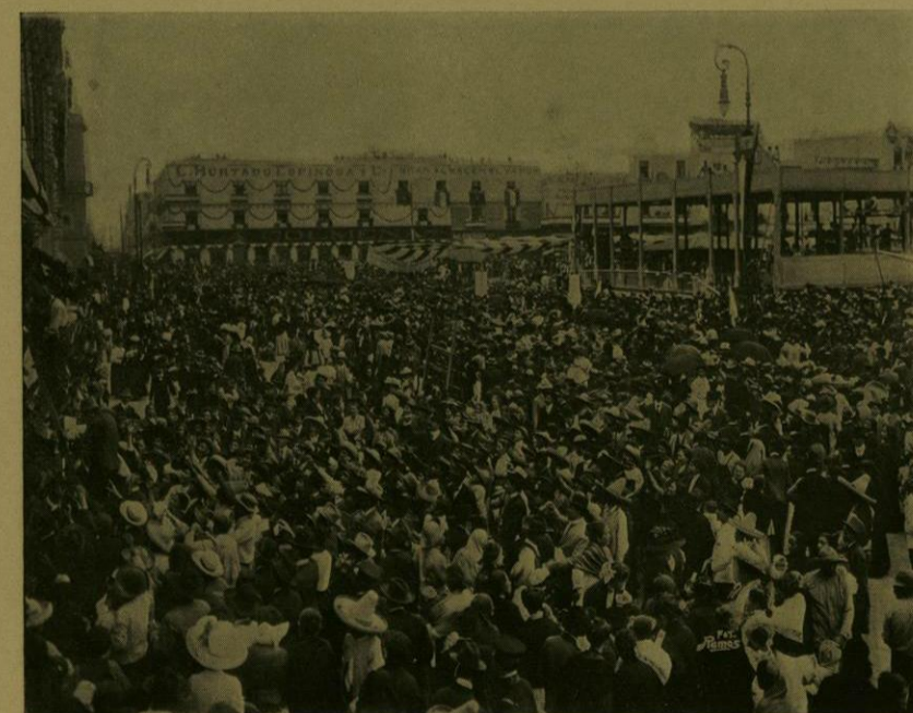
ASPECTO DE LA PLAZA DE LA CONSTITUCION AL TERMINAR EL PASO DE LA GRAN PROCESION CIVICA.

Seguían las Secretarías de Estado, encabezadas por la de Relaciones Exteriores é integradas por comisiones de empleados de los departamentos y secciones de cada una de ellas. Con la de Gobernación marcharon el Consejo de Salubridad, los alumnos de la Escuela Industrial de Huérfanos, varios jefes de cuerpos rurales y comisiones de la policía y de los establecimientos de reclusión penal; con la de Justicia, los empleados superiores del ramo; con la de Hacienda, los delegados de la Tesorería de la Federación, de las oficinas del Timbre y de la Dirección de Contribuciones; con la de Comunicaciones, los empleados de Correos y los de Telégrafos; con la de Instrucción Pública y Bellas Artes, numerosos profesores, los alumnos de la Escuela Prepara-