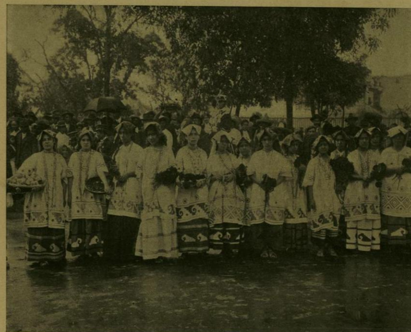
DESFILE HISTORICO.—DAMAS MEXICANAS.

cas, jefes de la República de Tlaxcala y porta-estandartes. En el segundo cuadro formarían doscientos ochenta y ocho personas con trajes adecuados, entre las que estarían el Virrey, los oidores de la Audiencia, los miembros del Ayuntamiento, los consejeros del Rey, el Alférez Real, los provinciales religiosos, los indios principales, gran número de militares y funcionarios civiles y muchos personajes de inferior categoría; y en el tercero, los Generales don Agustín de Iturbide, don Vicente Guerrero, don Manuel Mier y Terán, don Guadalupe Victoria y don Anastasio Bustamante; algunas secciones de las que formaron el Ejército Trigarante, entre ellas las de los regimientos de Granaderos Imperiales, de la Corona, de Celaya, de Tres Villas, de Guadalajara, de Querétaro, Ligeros de Morelos, Fijo de Puebla, de México y de Valladolid, de Santo Domingo, de Fernando VII, de Dragones de México, del Rey, de Santander, Fieles del Potosí y otros, así como varios carros alegóricos enviados por los Estados de la Federación.