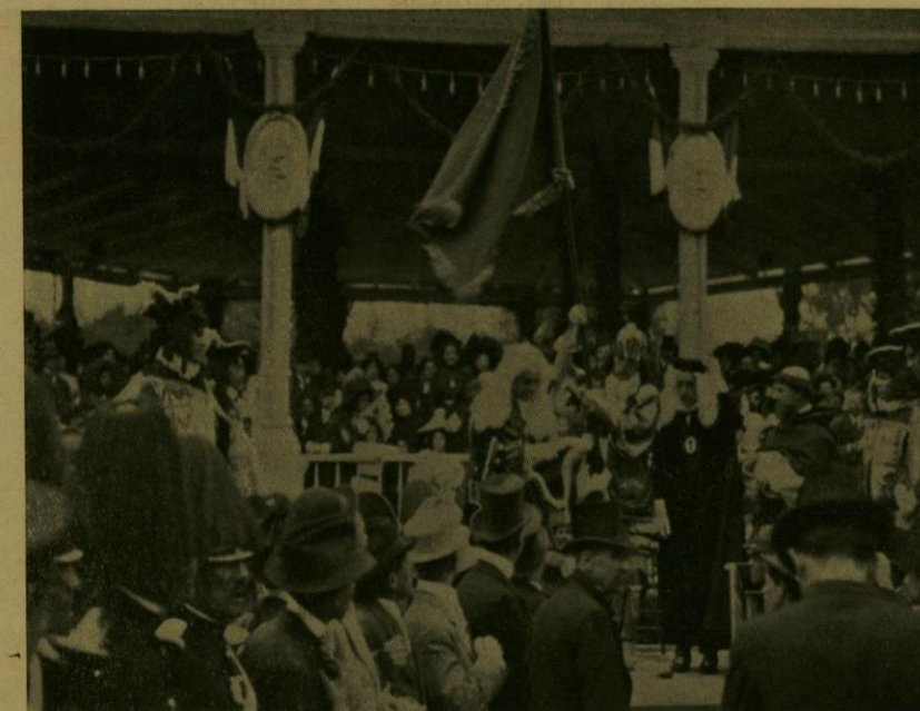
DESFILE HISTORICO.—LA JURA DEL PENDÓN.

dores, todos á caballo y representados, como su jefe, por alumnos de las Escuelas Superiores. Inmediatamente después venía un grupo de jóvenes indias, presidido por la Malintzin y escoltado por soldados españoles y tlaxcaltecas; en seguida caminaban varios frailes, que traían á la memoria á los misioneros que evangelizaron el país conquistado; muchos soldados españoles, con sus trajes y armas característicos, y, por último, guerreros de la República de Tlaxcala, aliados de Cortés.