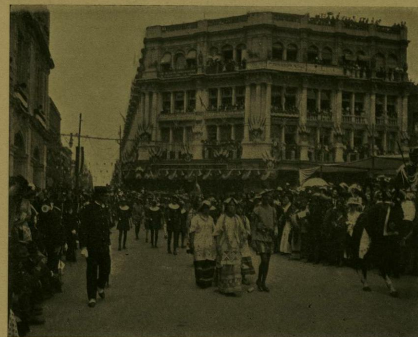
DESFILE HISTORICO.—DOÑA MARINA Y SUS ACOMPAÑANTES.

Por lo que hace al primer cuadro, deberían componerlo un grupo mexicano compuesto por diez y nueve guerreros con estandarte fijo, un Gran Capitán escoltado por ocho guerreros con divisa, cincuenta guerreros, treinta y ocho sacerdotes, los señores de los Reinos inmediatos á Tenoxtitlan acompañados por veinte caballeros del sol, quince nobles, veinte indias principales resguardadas por seis guerreros con estandarte fijo y dos caballeros-tigres, numerosos servidores con alfombras, el Emperador Motecuhzoma y su corte, varios guerreros-sacerdotes y, por último, una retaguardia militar; y el grupo español, integrado por una descubierta de escopeteros á caballo y á pie, atambores y clarines, ballesteros, Cortés con doña Marina (Malintzin) y sus capitanes, frailes, servidumbre de aquél, arcabuceros, guerreros tlaxcalte-