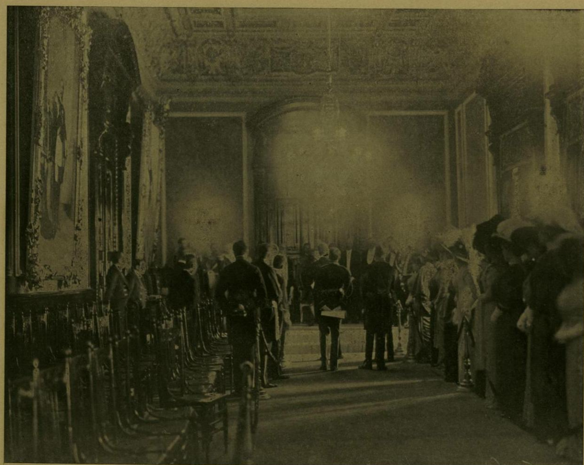
LA ENTREGA DE CREDENCIALES DE S. E. EL SR. EMBAJADOR DE ESTADOS UNIDOS.

residente de la República y fué brillantemente ejecutado por la orquesta del Conservatorio, se puso en pie el Excelentísimo señor Conde Massiglia, Ministro de Italia en México, y pronunció un elocuente discurso para ofrecer, en nombre de su Soberano, al Gobierno de la República, el precioso obsequio; puso de relieve el valor artístico de la estatua y la significación espiritual del regalo hecho á México, como testimonio de la fraternidad que liga á dos Naciones de la misma familia é idénticos ideales, y elogió expresivamente al señor Presidente de la República. 1