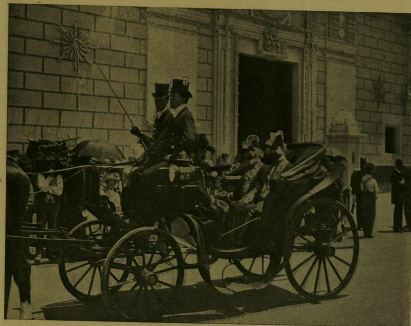
SS. EE. LOS SRES. ENVIADOS ESPECIALES DE CHILE PARTEN DE PALACIO DESPUES DE ENTREGAR SUS CREDENCIALES.

estuvo caracterizado por elementos decorativos del arte japonés. Integraron la selecta concurrencia personajes administrativos, miembros de las Misiones Extranjeras acreditadas en México, Jefes del Ejército Nacional y un grupo de damas, cuya hermosura y distinción fueron gala de la lucida fiesta.