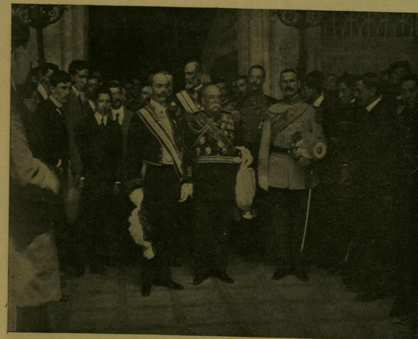
S. E. EL SR. ENVIADO ESPECIAL DE ESPAÑA, ACOMPAÑADO POR LOS SRES. SUBSECRETARIO DE RELACIONES EXTERIORES Y JEFE DEL ESTADO MAYOR PRESIDENCIAL, SALE DE PALACIO DESPUES DE ENTREGAR SUS CREDENCIALES.

La ceremonia fué sencilla y majestuosa. Sobre la plataforma en donde tomó asiento el señor Presidente de la República, se entrecruzaban el pabellón de las estrellas y la enseña tricolor, confundándose como las dos Naciones que en aquellos instantes se unían por el amor santo á los héroes, que es el lazo sagrado de una religión cívica. La selecta concurrencia ocupó una gran tribuna severamente adornada.