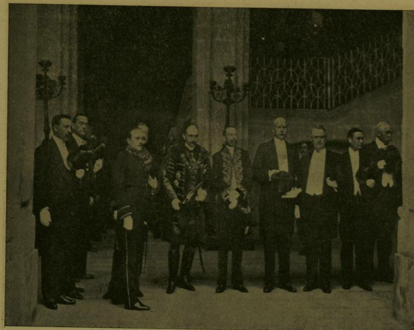
LAS MISIONES HONDUREÑA, AUSTRO-HUNGARA Y NORTEAMERICANA SALEN DE PALACIO DESPUES DE ENTREGAR SUS CREDENCIALES.

estuvo caracterizado por elementos decorativos del arte japonés. Integraron la selecta concurrencia personajes administrativos, miembros de las Misiones Extranjeras acreditadas en México, Jefes del Ejército Nacional y un grupo de damas, cuya hermosura y distinción fueron gala de la lucida fiesta.