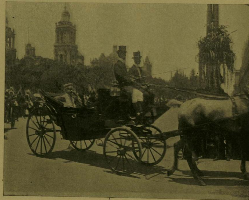
S. E. EL SR. ENVIADO ESPECIAL DE CUBA ENTRA EN PALACIO A ENTREGAR SUS CREDENCIALES.

El adorno del local y de las mesas fué de exquisito gusto y