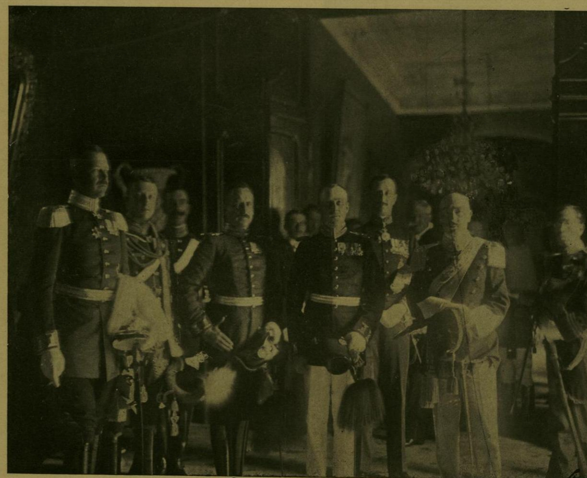
LOS SECRETARIOS Y AGREGADOS DE LAS EMBAJADAS ALEMANA, ITALIANA Y JAPONESA SALEN DE PALACIO DESPUES DE LA ENTREGA DE CREDENCIALES DE SUS JEFES.

El regalo consistió en dos hermosos tibores, llegados á la Capital con el contingente artístico de la Exposición Japonesa, donde fueron exhibidos y llamaron poderosamente la atención. Son de porcelana negra; tienen delicadísimas incrustaciones de oro, perla y nácar, y miden cerca de un metro de altura. Entre esas incrustacionesse destacan dos