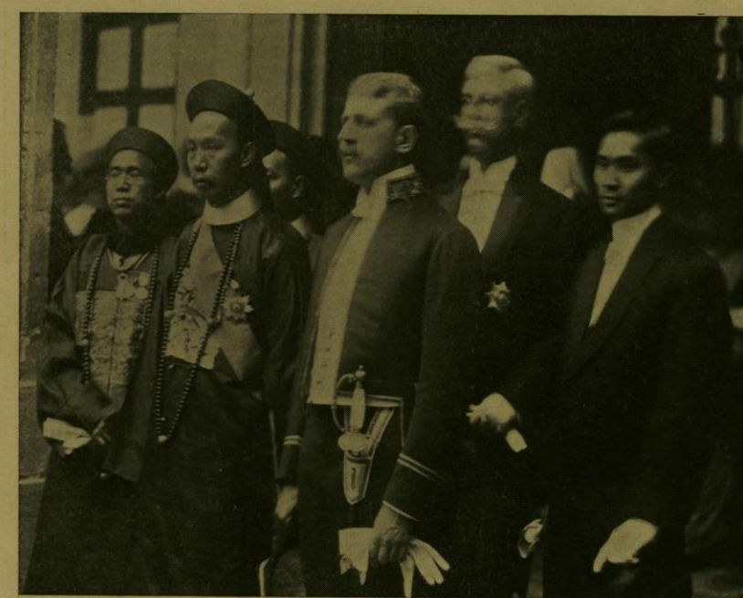
LA EMBAJADA CHINA SALE DE PALACIO DESPUES DE ENTREGAR SUS CREDENCIALES.

De nuevo se dejó oír el Himno Nacional, cuyos acordes ardientes y evocadores de recuerdos gloriosos, al resonar después de la Marcha Italiana, aumentaron el espíritu afectuoso que presidió la fiesta y confirmaron la unión de dos pueblos que son ramas del frondoso árbol latino.