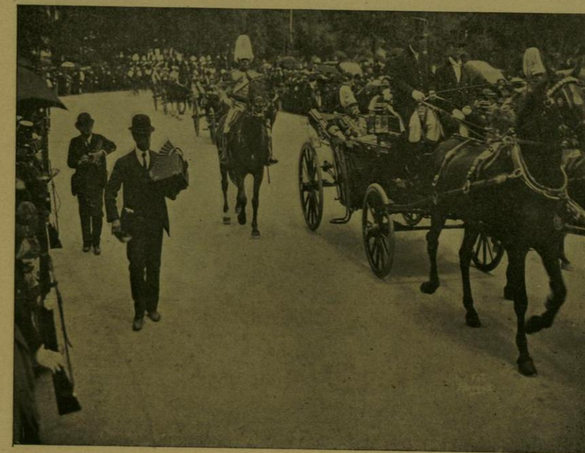
S. E. EL SR. ENVIADO ESPECIAL DE ESPAÑA MARCHA A PALACIO A ENTREGAR SUS CREDENCIALES.

Monumento á Washington. —La colonia norteamericana residente en la Capital, no satisfecha con la excepcional cortesía de los Supremos Poderes de su patria, que se hicieron representar en las fiestas del Centenario por un Embajador y varios Enviados Especiales, quiso también dar una muestra de amor á México y de homenaje á la fecha heroica que se conmemoraba, y al efecto, abrió una subscripción entre todos sus com-