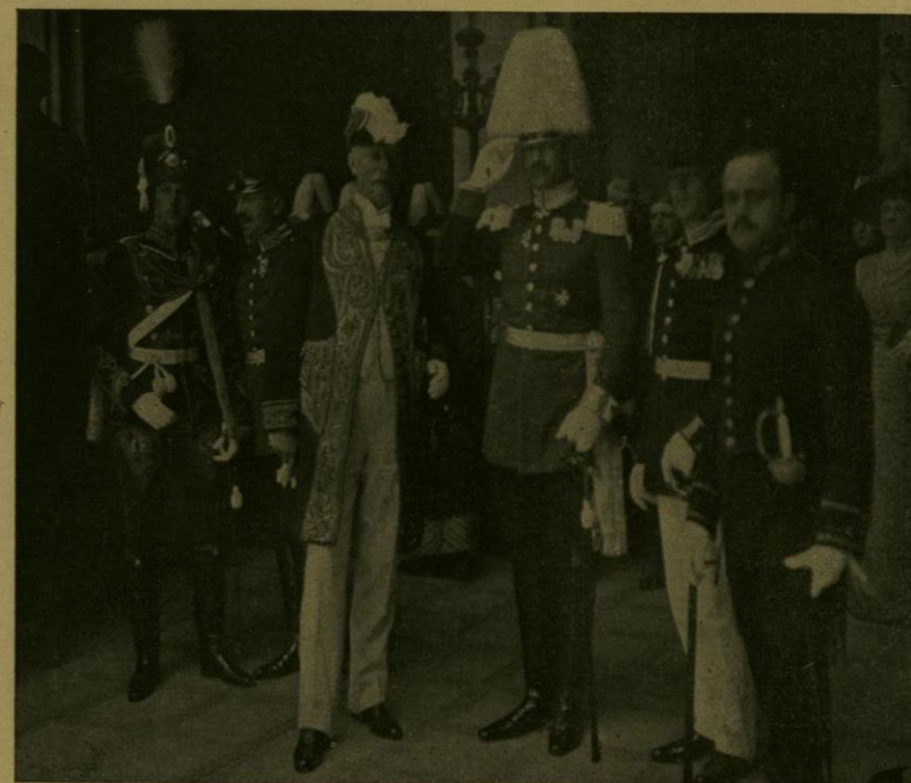
LA EMBAJADA ALEMANA SALE DE PALACIO DESPUES DE ENTREGAR SUS CREDENCIALES.

Cuando dejaron de oirse los marciales acordes del Himno Nacional, que saludó la llegada del señor