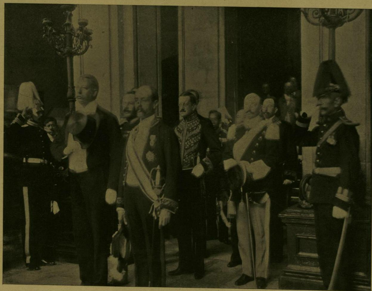
S. E. EL SR. EMBAJADOR DE ESTADOS UNIDOS Y EL SR. SUBSECRETARIO DE RELACIONES EXTERIORES SALEN DE PALACIO, A LA CABEZA DE LAS DEMAS EMBAJADAS, DESPUES DE LA ENTREGA DE CREDENCIALES.

y enaltecía la memoria de Donatello, que con magia creadora le infundió vida poderosa. Todos advertían en la estatua la distinción delicada, la gracia encantadora, la dignidad y la fuerza, que nadie expresó como Donatello, el digno precursor de Miguel Angel, que supo sellar con sus obras maravillosas el principio de aquella resurrección del antiguo espíritu de Grecia, sin hacer morir el nuevo de Italia. Al propio tiempo, la delicada idea de Su Majestad Víctor Manuel III, de dar á México un testimonio de su afecto, en ocasión tan solemne para los mexicanos, despertaba los más vivos sentimientos de simpatía hacia la legendaria madre de la raza latina y hacia el noble Soberano que rige sus destinos.