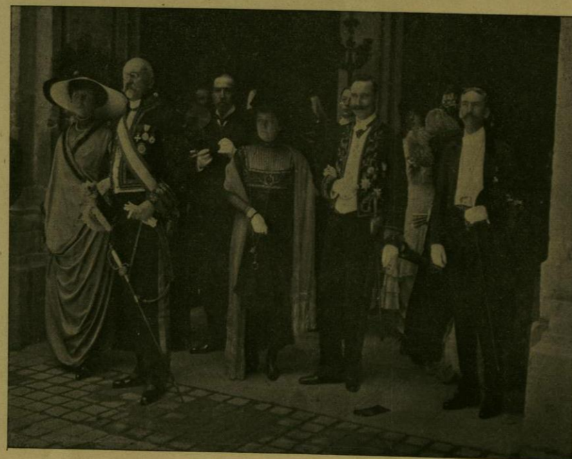
VARIOS MIEMBROS DEL CUERPO DIPLOMATICO RESIDENTE SALEN DE PALACIO DESPUES DE UNA ENTREGA DE CREDENCIALES.

El Excelentísimo señor Embajador ofreció el banquete con