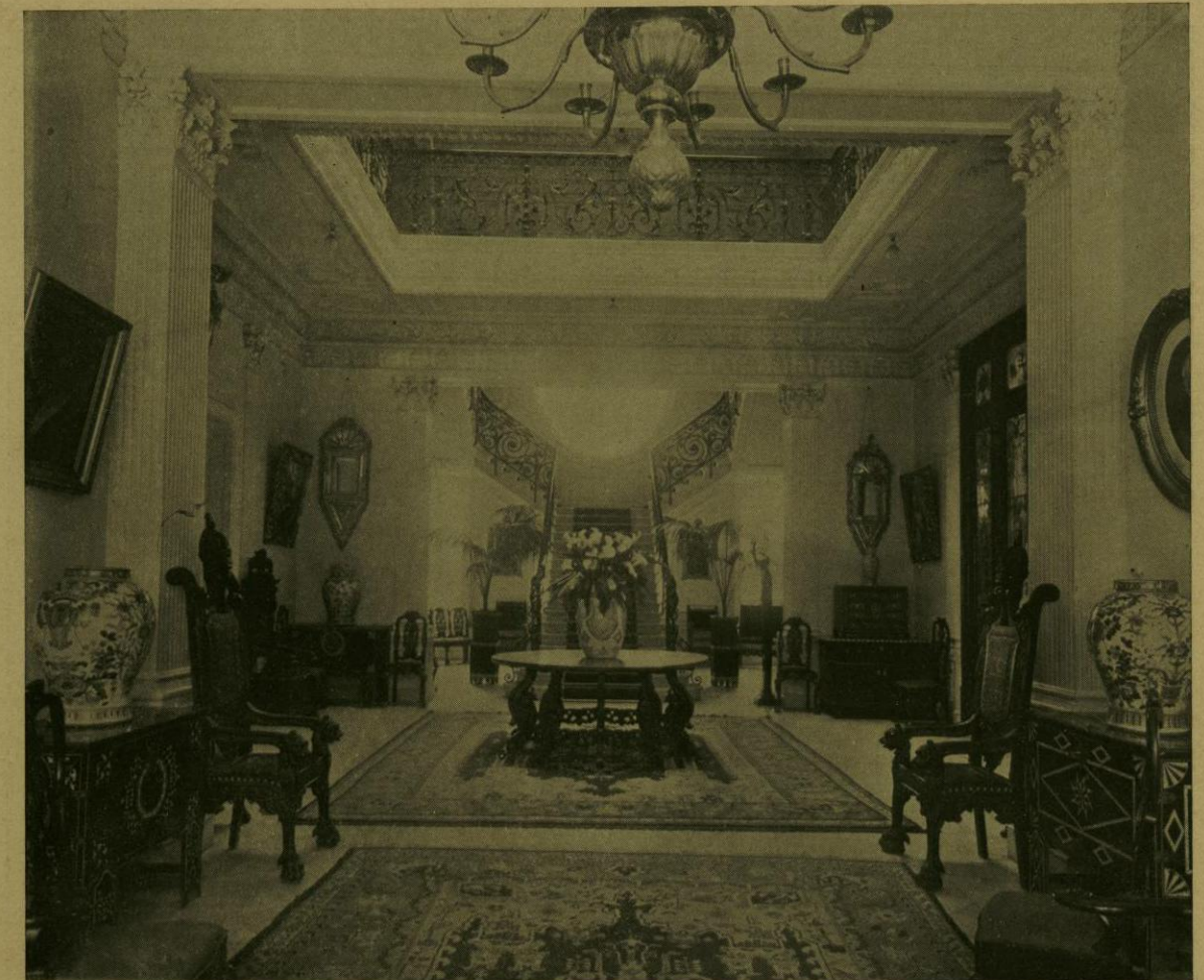
HALL DE LA RESIDENCIA DE S. E. EL SR. MARQUES DE POLAVIEJA.