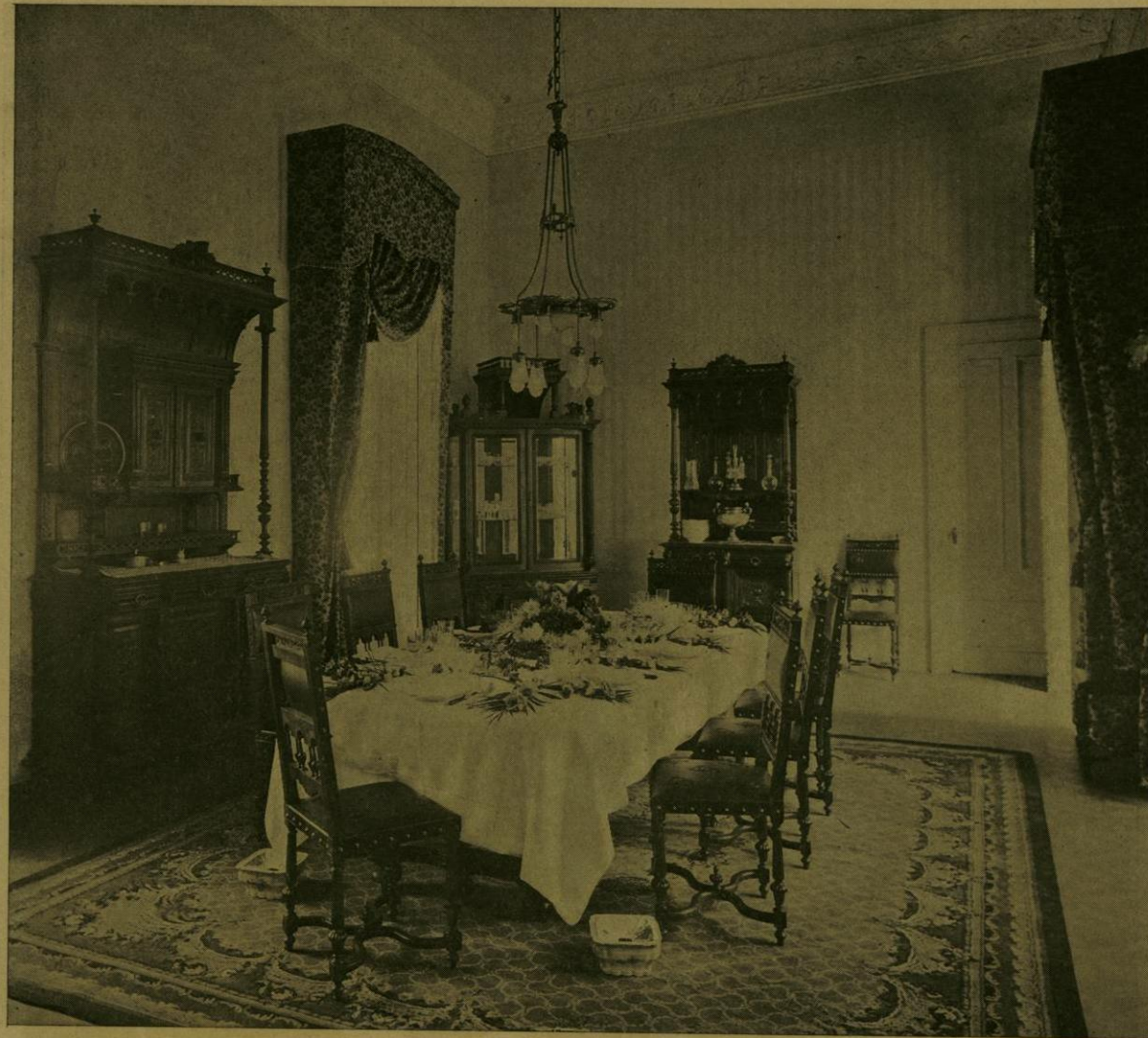
COMEDOR DE LA RESIDENCIA DE LA EMBAJADA CHINA.