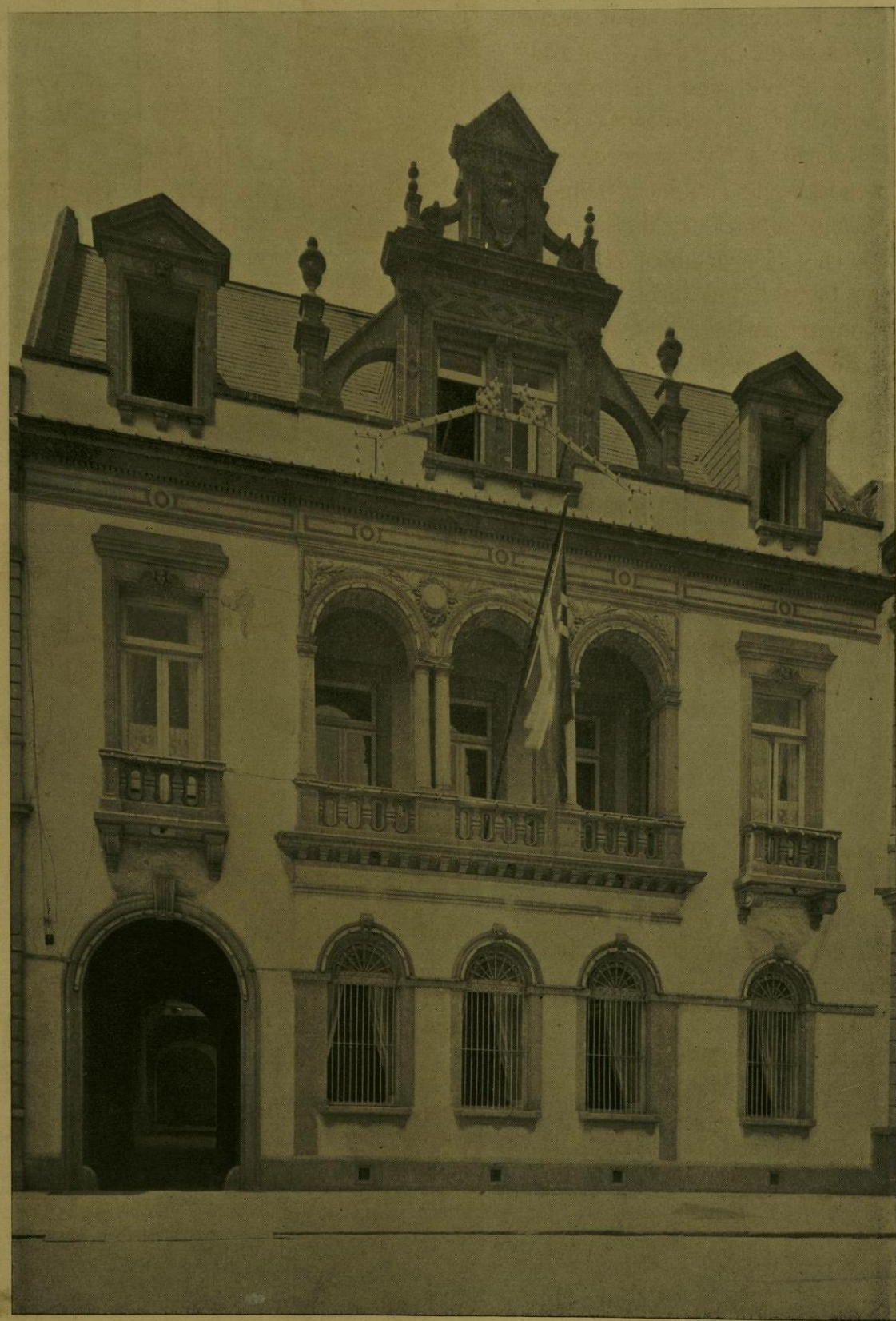
CASA QUE SIRVIÓ DE RESIDENCIA A LA EMBAJADA CHINA.