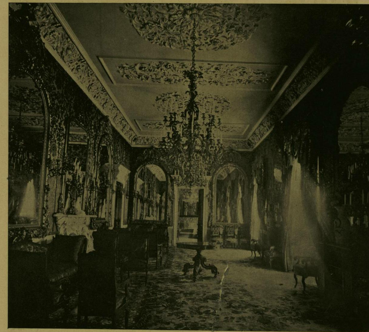
SALA DE LA RESIDENCIA DE S. E. EL SR. MARQUES DE POLAVIEJA.