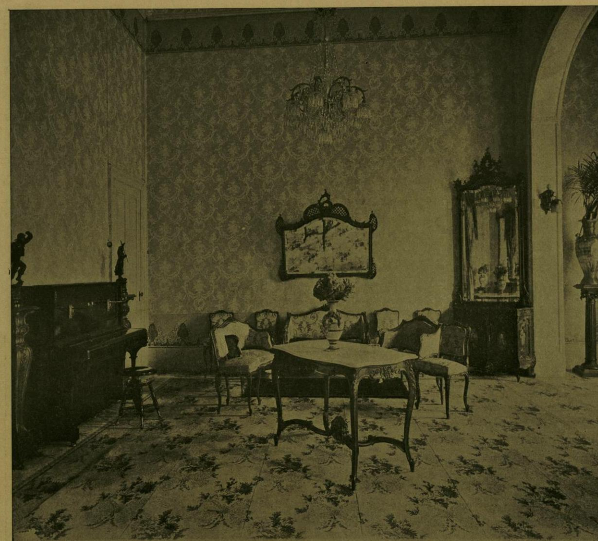
ANTESALA DE LA RESIDENCIA DE LA EMBAJADA CHINA.