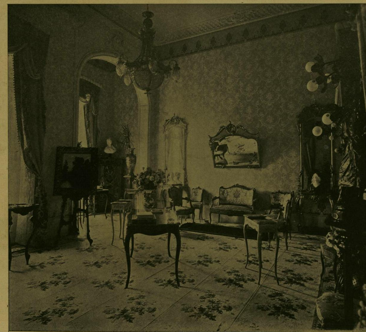
SALA DE LA RESIDENCIA DE LA EMBAJADA CHINA.