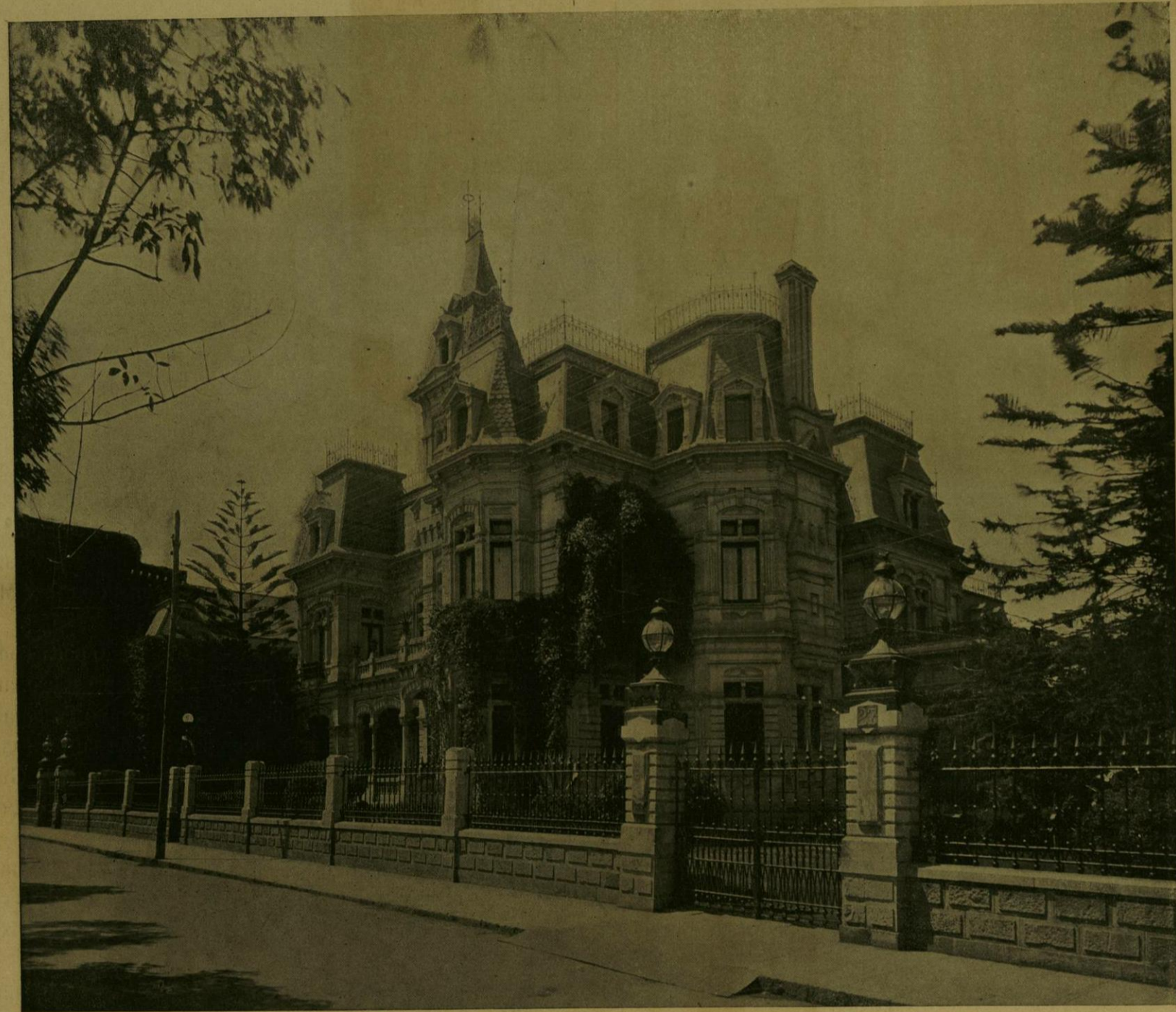
CASA DE LA SRA. VIUDA DE BRANIFF, QUE SIRVIÓ DE RESIDENCIA A LA EMBAJADA JAPONESA.

El señor Embajador y sus acompañantes sólo permanecieron breves momentos en Veracruz, pues tomaron luego el tren para Orizaba, en donde pernoctaron; de allí siguieron rumbo á la Capital, á la que llegaron á las 10.30 a. m. del día 4; en