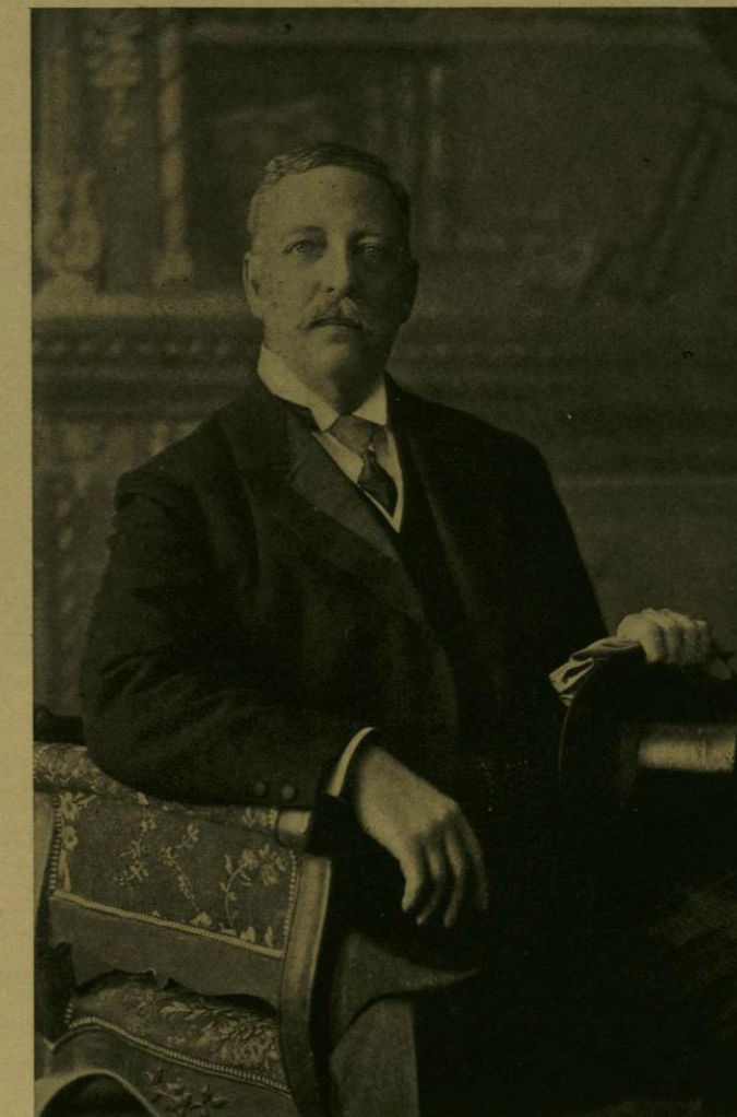
S. E. EL SR. CURTIS GUILD (JR.).

rrera militar, y de ascenso en ascenso llegó hasta desempeñar los siguientes importantes cargos: Capitán General de Andalucía, Director General de Infantería, Gobernador y Capitán General de la isla de Cuba, Director General de la Guardia Civil, Comandante en Jefe del sexto Cuerpo de Ejército, Jefe del Cuarto Militar de Su Majestad la Reina Regente, Gobernador y Capitán General