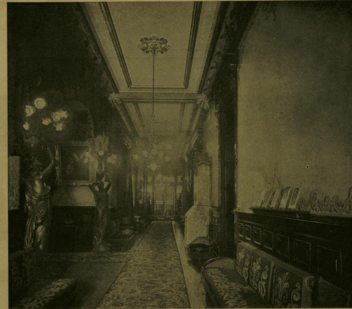
CORREDOR DE LA RESIDENCIA DE LA EMBAJADA JAPONESA.

El Excelentísimo señor don Camilo García de Polavieja y del Castillo Negrete nació en Madrid, el 13 de julio de 1838. Dedicóse á la ca-