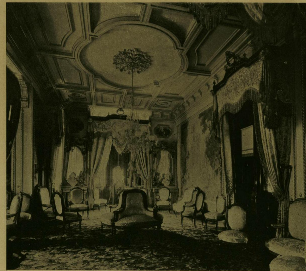
SALA DE LA RESIDENCIA DE LA EMBAJADA JAPONESA.