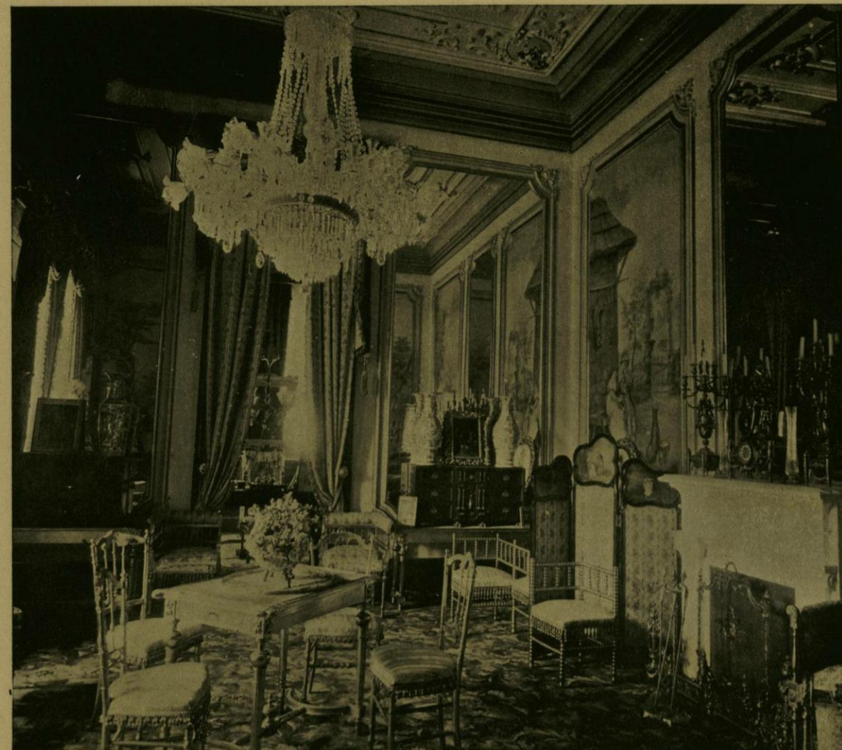
ANTESALA DE LA RESIDENCIA DE LA EMBAJADA JAPONESA.