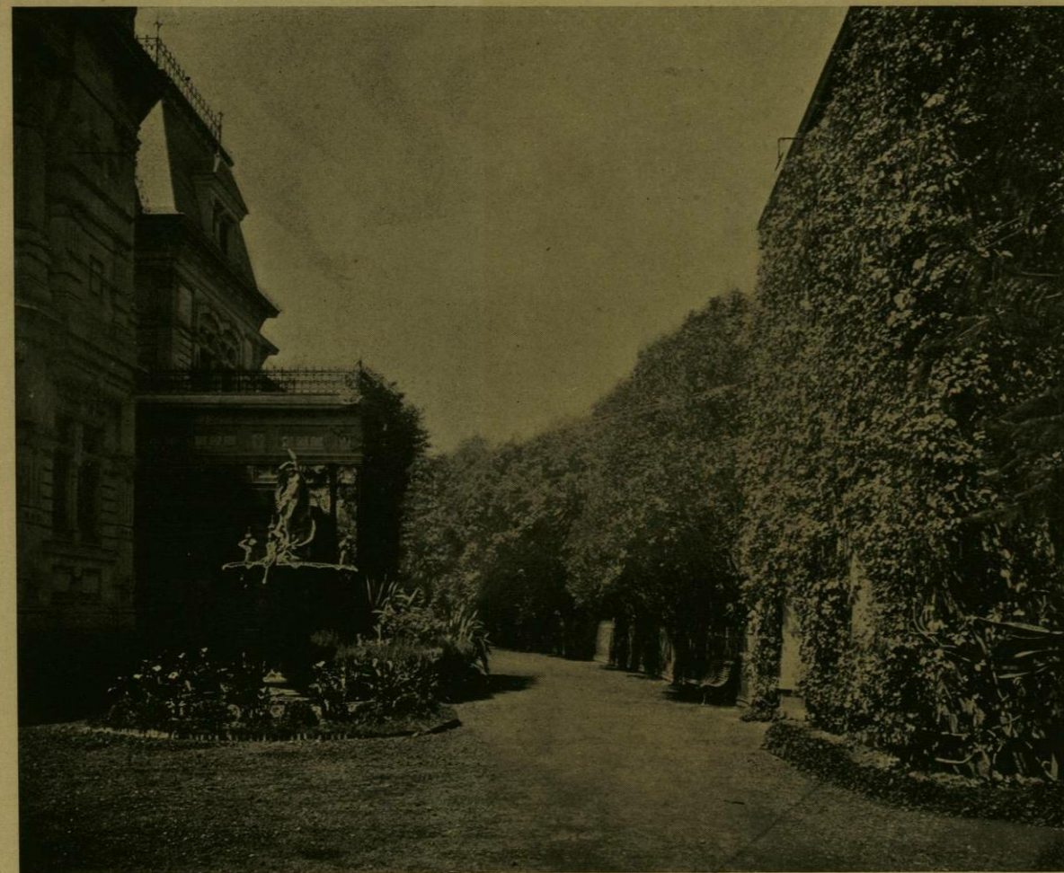
JARDIN DE LA RESIDENCIA DE LA EMBAJADA JAPONESA.