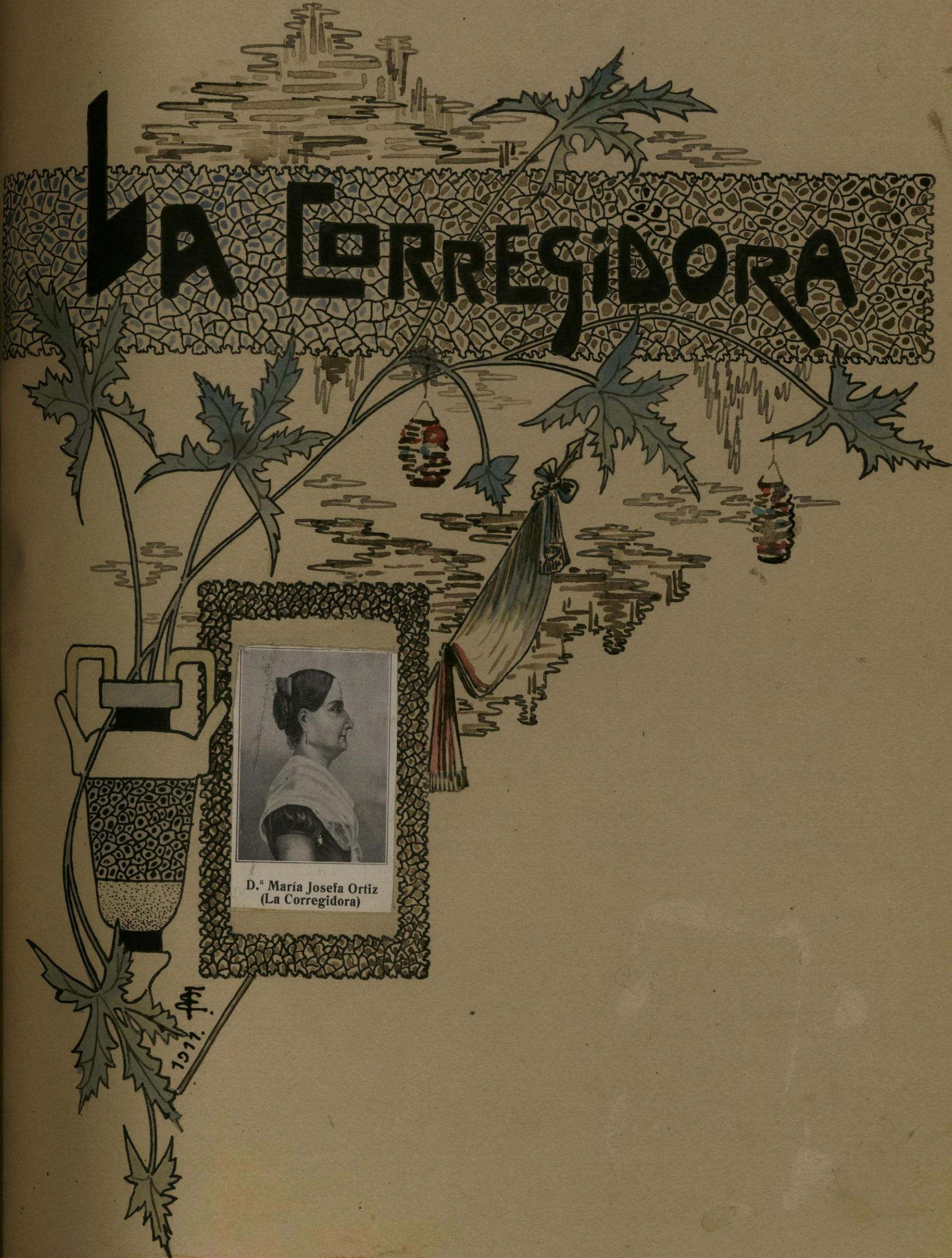
D.ª Maria Josefa Ortiz (La Corregidora)