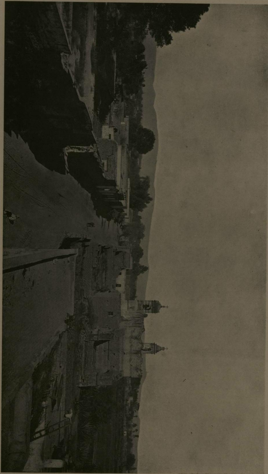
PUEBLO DE SAN JUANICO, PREFECTURA DE TACUBA, D. F.—ESTADO ACTUAL.

dad: ¿cómo ella, tan inteligente é ilustrada, había de juzgar que era delito el patriotismo, una de las supremas virtudes humanas?