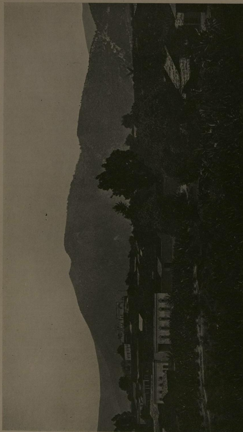
PUEBLO DE HUISQUILUCAN, DISTRITO DE TLALNEPANTLA, ESTADO DE MEXICO.—ESTADO ACTUAL.