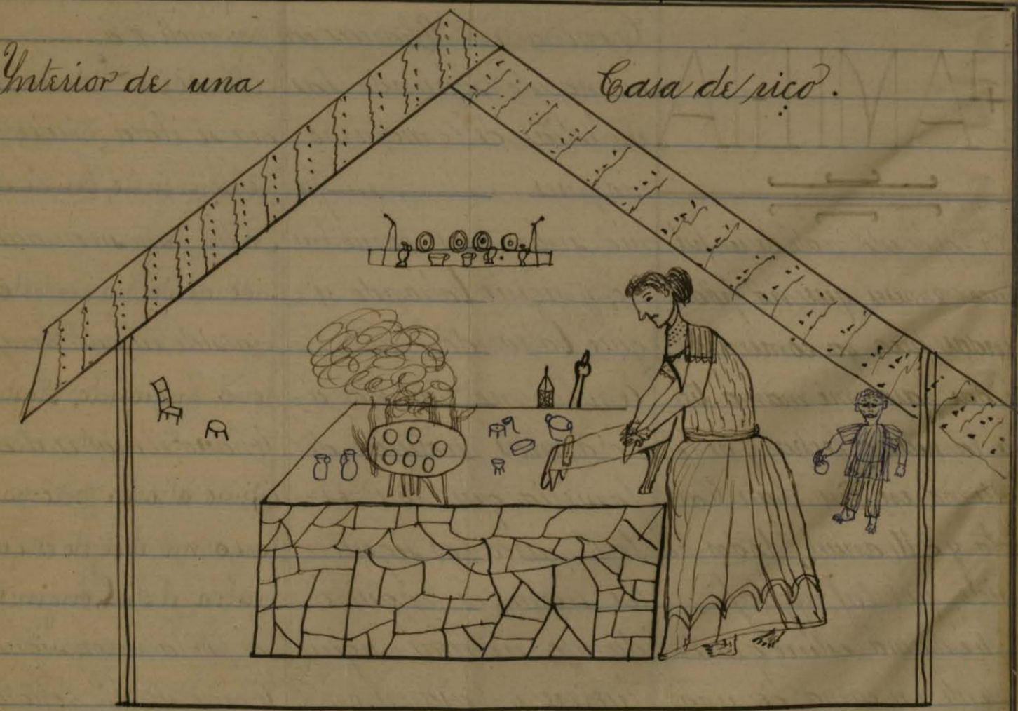
Costumbres de Ahuacatlán N.º 2.