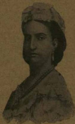
Emperatriz Carlota Amalia.