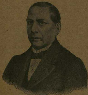
Don Benito Juárez.