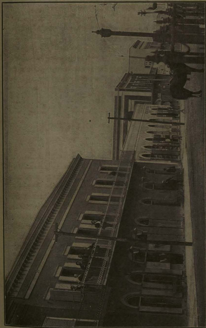
Palacio Municipal. — H. Matamoros.