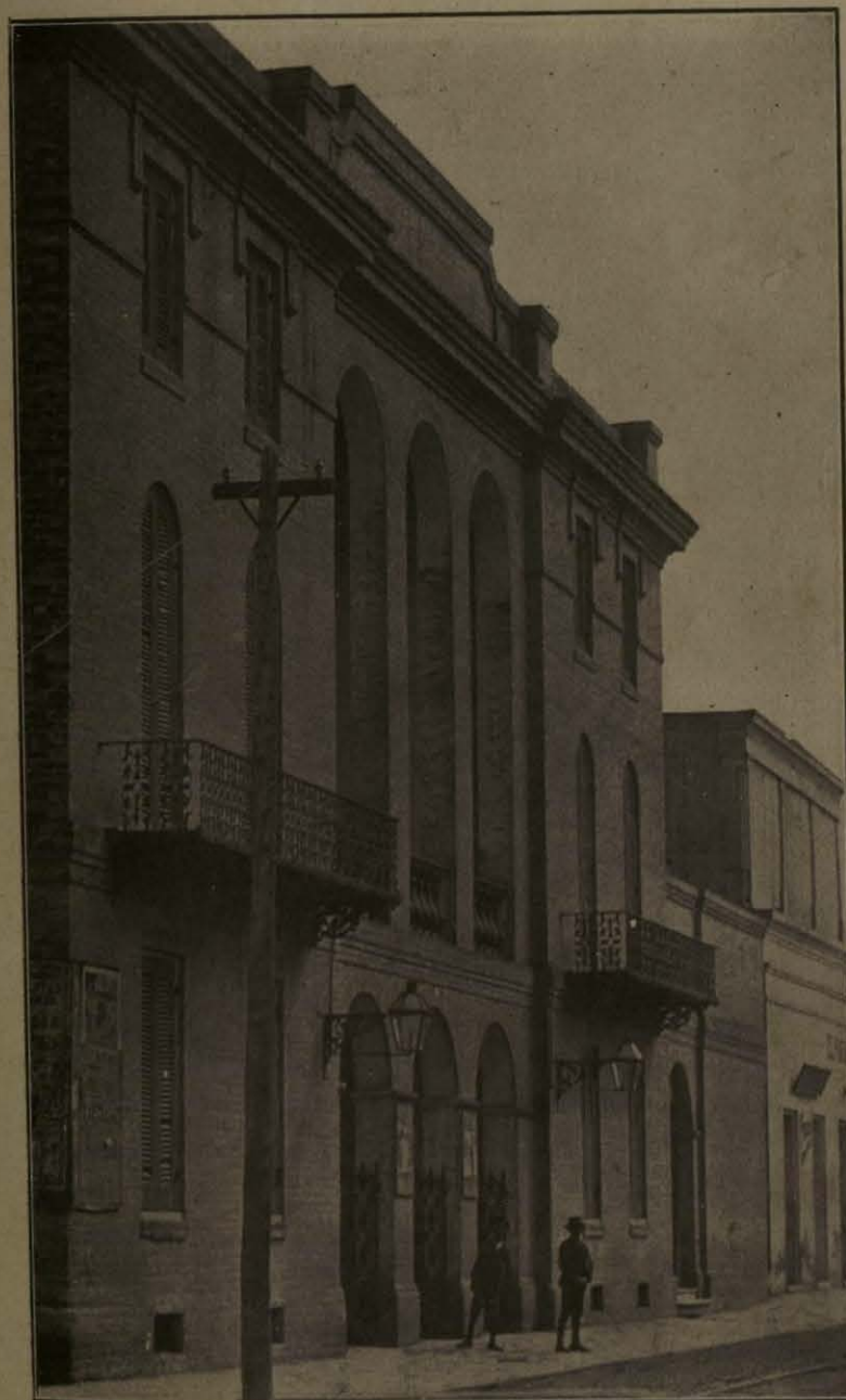
Teatro de la Reforma.—H. Matamoros.