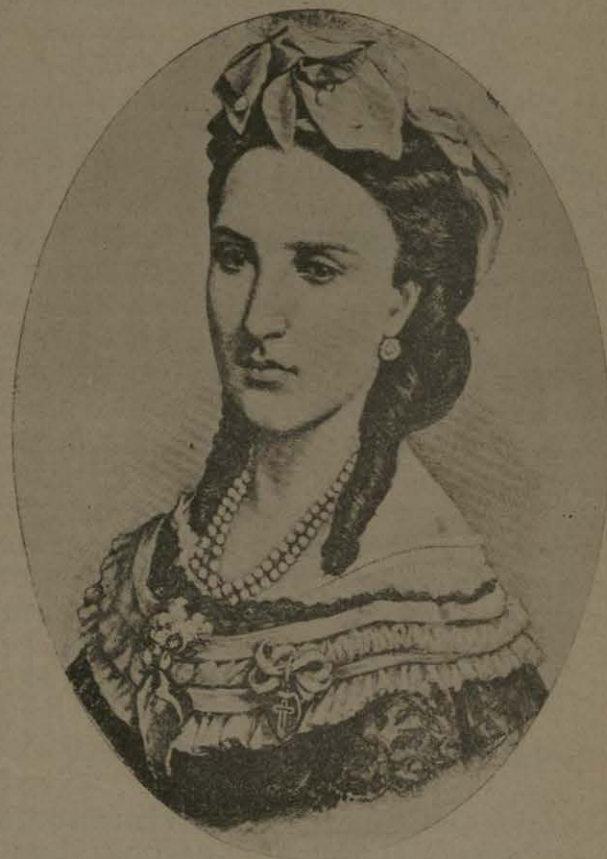
EMPERATRIZ CARLOTA AMALIA.

La división Doblado salió del Saltillo para el interior con objeto de detener y presentar batalla si era posible, á la división Mejía que se dirigía para la frontera. Este