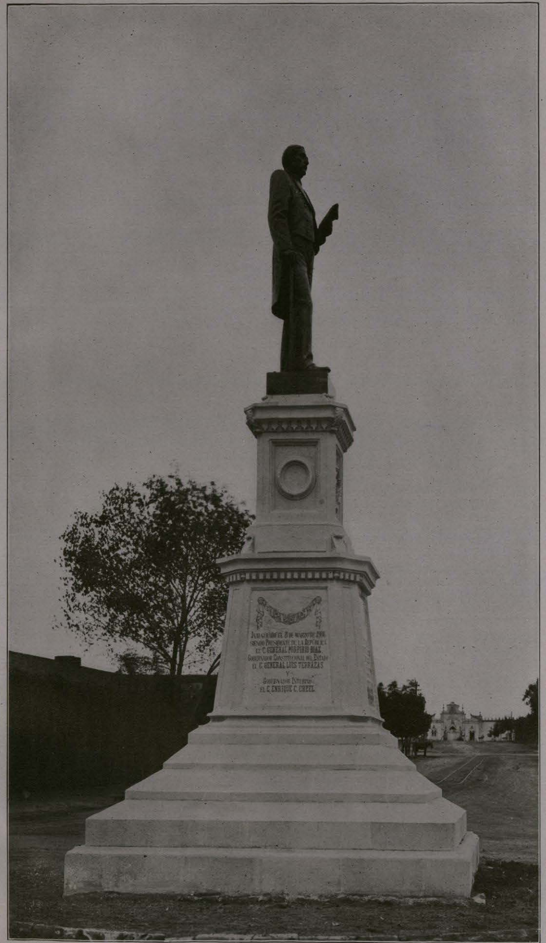
MONUMENTO Á JUÁREZ.