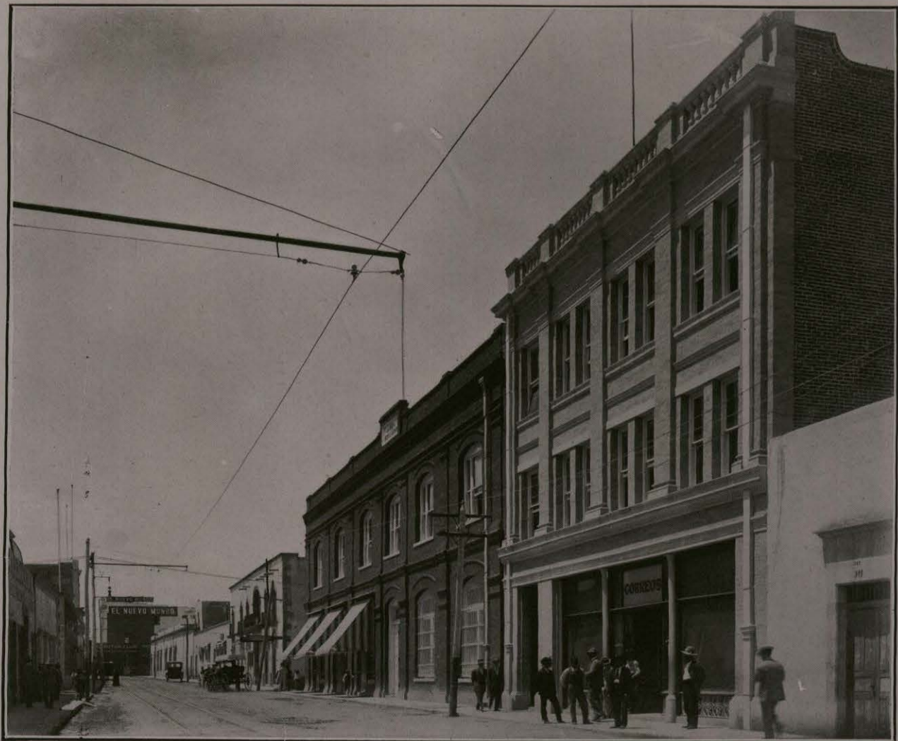
OFICINA DE CORREOS.