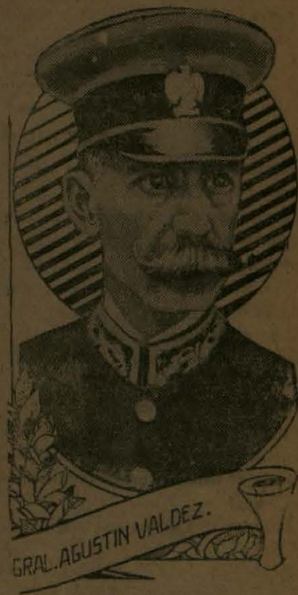
GRAL. AGUSTIN VALDEZ.