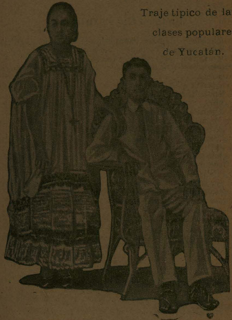
Traje típico de las clases populares de Yucatán.

Marcha de acuerdo con el Gobierno del centro, secundando las miras pacifistas y de cordialidad que animan al señor Gral. Huerta y su Gabinete,