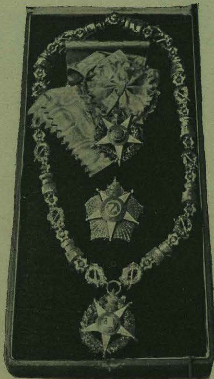
Gran Cruz y placa de la Orden de Carlos III de España.—Gran Cruz y placa del Mérito Militar. Igual procedencia.—Gran Cruz y placa de la Orden de la Torre de Portugal.