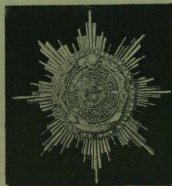
Gran Cruz de la Orden del León y del Sol de Persia, conferida por S. M. el Shah recién muerto. Gran Cruz de la Orden de la Crisantema del Japón. Gran Cruz de la Orden del Dragón Imperial de China.