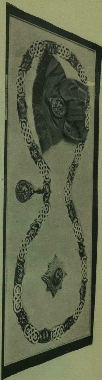
Gran Cordón del Aguila Roja de Prusia, conferido por S. M. I. y R. Guillermo II, Rey de Prusia y Emperador de Alemania. Gran Cruz, collar y placa de la Orden del Baño, conferida por S. G. M. Eduardo, VII, Rey de la Gran Bretaña y Emperador de las Indias. Gran Cruz de la Orden de la Espada, conferida por S. M. Oscar II de Suecia.