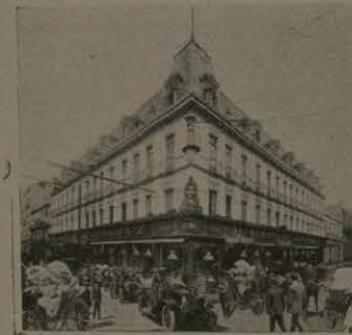
Al Puerto de Veracruz.