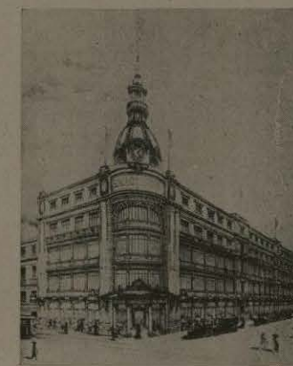
El Palacio de Hierro.