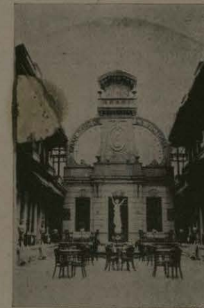
Baños "La Victoria."