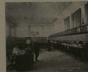
Empresa de Teléfonos Ericsson.