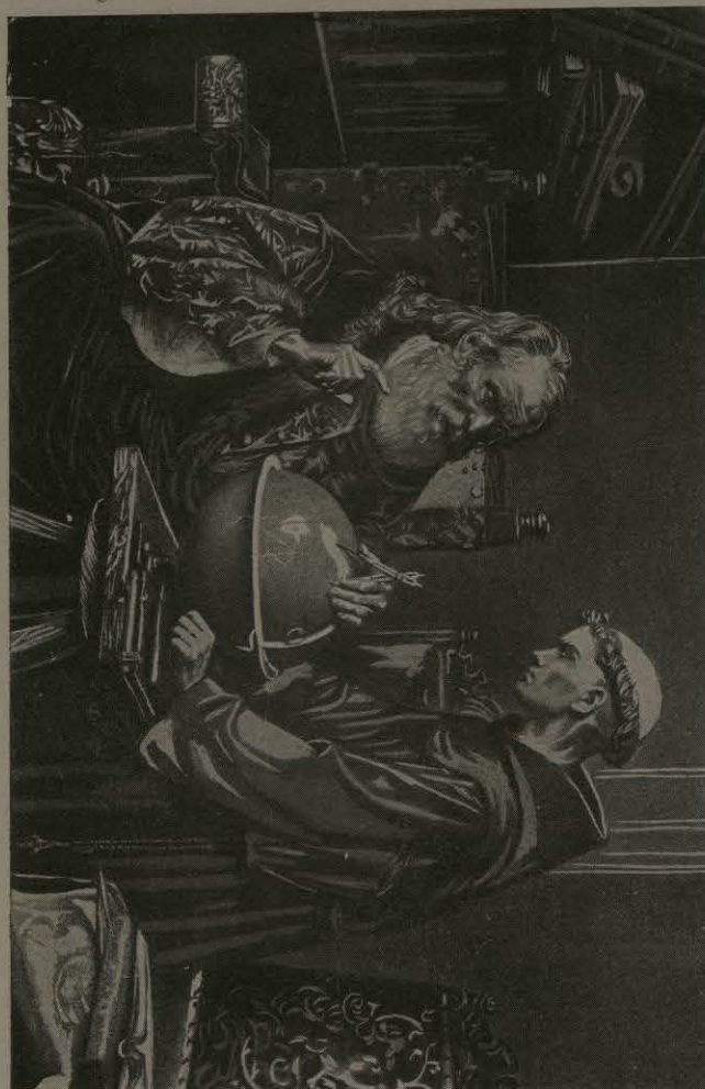
"GALILEO"—(CUADRO DE D. FÉLIX PARRA.)

El mejor pintor de retratos en México es Herman Gedovius, quien piensa como un mexicano ó latino y pinta como un alemán. Esto se debe á que lleva sangre alemana en sus venas, que nació y creció en México y que ha recibido su educación artística en los mejores centros de Europa. Pero Gedovius no es un imitador, pues desde su regreso á su tierra natal, hará como quince años, ha desarrollado un estilo vigoroso, imaginativo y pintoresco, notable por su atrevimiento, que es característicamente suyo. Es el artista "per se" y toda su vida se envuelve en su trabajo. En suma, las producciones de Gedovius han sufrido una notable transformación durante los doce últimos años. Antes sus pinturas eran más cuidadosamente acabadas hasta revelar cierta atención y cui-