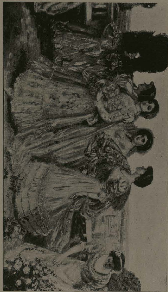
“LA PRIMAVERA.”—CUADRO DE D. ALFREDO RAMOS MARTÍNEZ.

Las razas indígenas tenían, además, su propia música nativa, á la cual consagraban una gran atención. A los niños ricos se les enseñaba en los templos bajo la dirección de los sacerdotes: y uno de los ramos de estudio al cual se prestaba preferente dedicación era el aprendizaje del "ribal" ó cánticos nacionales, y de éstos, más especialmente, aquellos dedicados al servicio de los dioses. Se vé por esto que entre los habitantes originales de México, ocupaban un sitio de honor al lado de la oratoria, la pintura, la música y la poesía. Sería, por lo mismo, extraño que el pueblo mexicano no hubiese continuado siendo adicto á esas artes, que fueron un legado de sus antecesores tanto del Nuevo como del Viejo Mundo, pues en ese temperamento y natural inclinación de las razas nativas de México, fué ingertada la cultura de España, á su vez influenciada por todos los cen-