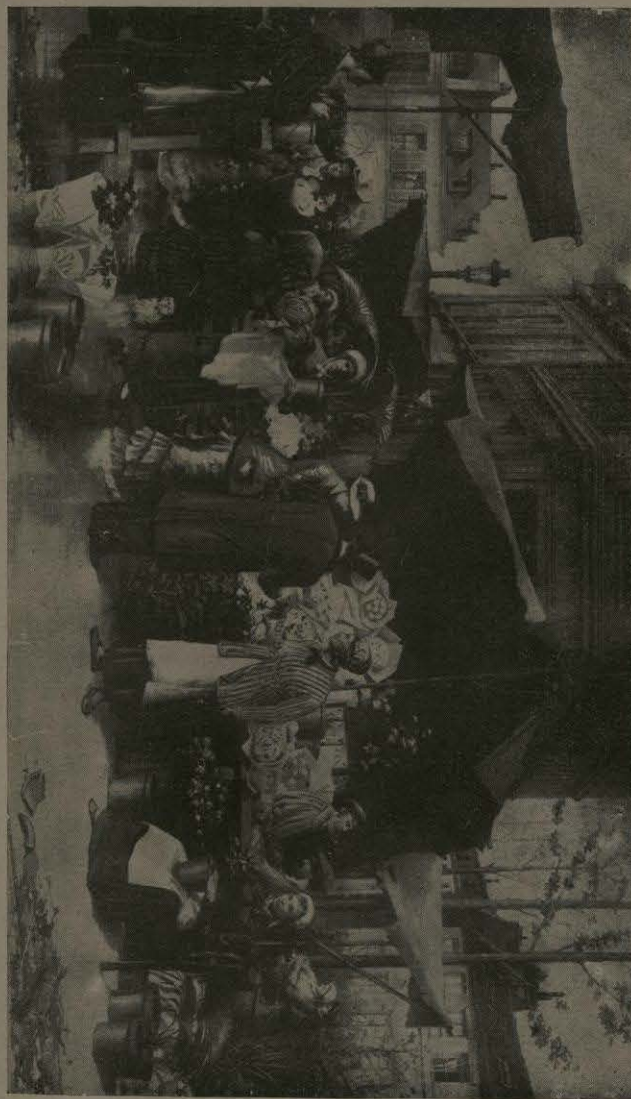
«EL MERCADO DE FLORES.»—(Cuadro de Don Félix Parra.)

Finalmente, otro de los sistemas de canales y túneles en construcción es el de Coacuilá, que aprovechará las aguas del río de este nombre.