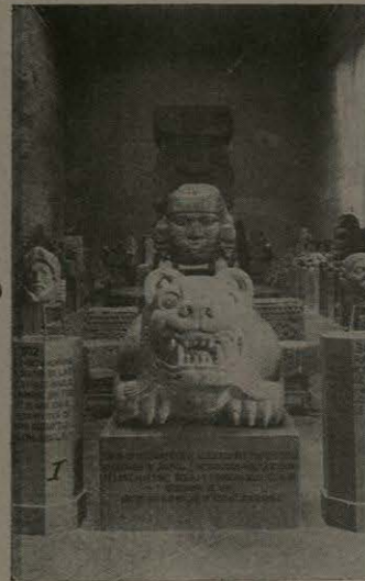
Salón de Monolitos.

El cuadro presentado por el impresionista, podrá ser muy interesante, como ha dicho un escritor francés; pero las relaciones del impresionista no merecen mucho crédito, por la misma razón de que es impresionista; lo cual implica que es el polo opuesto del investigador, que se dedica á estudiar con calma y paciencia las causas, las condiciones y los resultados de todo lo que vé. Desgraciadamente, los impresionistas andan desatados en México, y son tan numerosos y tan persistentes, y se han puesto tanto en evidencia, que con frecuencia han ahogado la voz de protesta del escritor sensato, que ha estudiado al país á fondo, y comprende todo el progreso que ha hecho, á pesar de innumerables y desalentadoras dificultades.