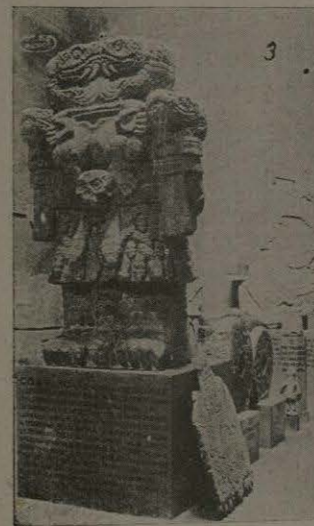
Coatlique, Madre del dios de la Guerra.