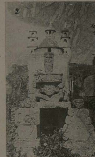
Capilla Antigua, Teotihuacán.