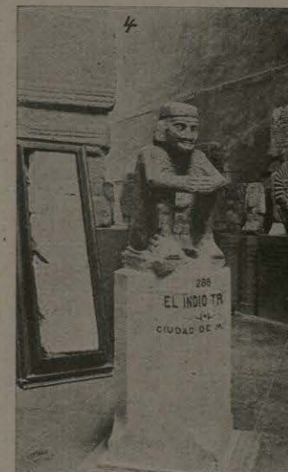
El Indio Triste.