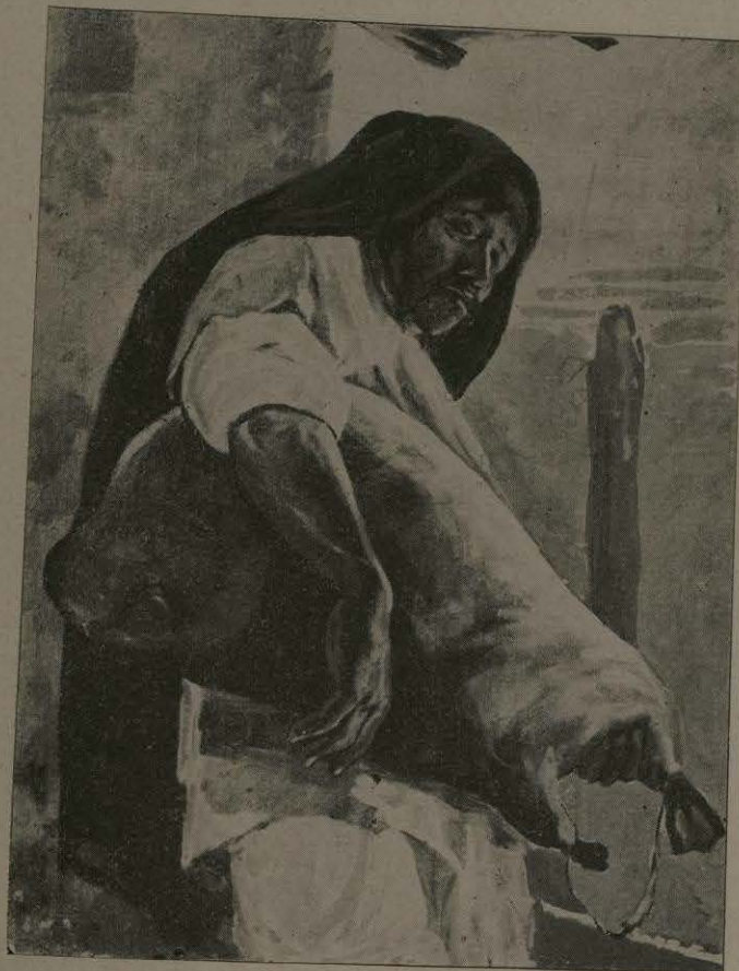
"TLACHIQUERO." (CUADRO DE D. LEANDRO ISAGUIRRE.)