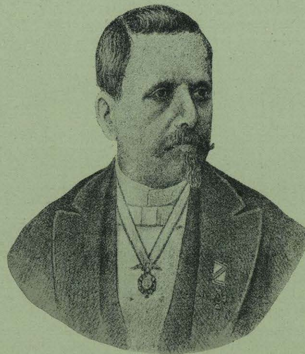
GENERAL GUILLERMO PALOMINO.

“Sudoroso y agitado por la fatiga, emprendí violentamente mi marcha para la casa donde tenía mis caballos, mi crido y el guía, y pude, sin más tropiezo llegar á ella.