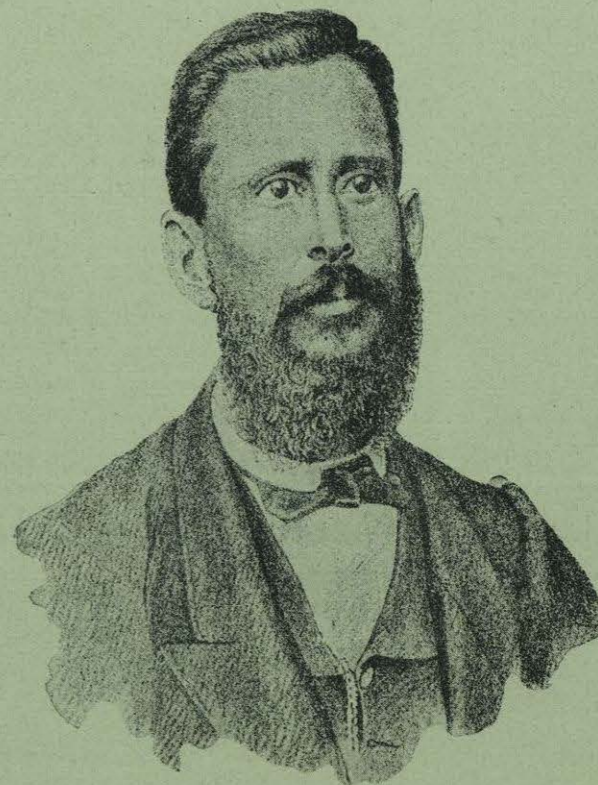
GENERAL LUIS PÉREZ FIGUEROA.

“El mal éxito que el Conde de Tum había alcanzado en su campaña de la sierra de Puebla le tenía de mal humor. Al día siguiente de su arribo á Puebla, vino á la prisión y me llamó al salón de la corte marcial, que estaba en el mismo edificio, y allí me previno, con maneras bastante duras, que firmara una carta, previamente escrita, en que ordenara yo al General D. Juan Francisco Lucas, que no fusilara á los jefes y oficiales traidores que tenía prisioneros, porque el gobierno imperial se proponía canjearlos por algunos