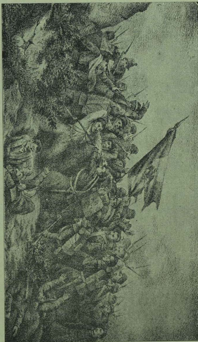
UN EPISODIO EN EL SITIO DE PUEBLA.

Más de una vez han dicho los enemigos del General